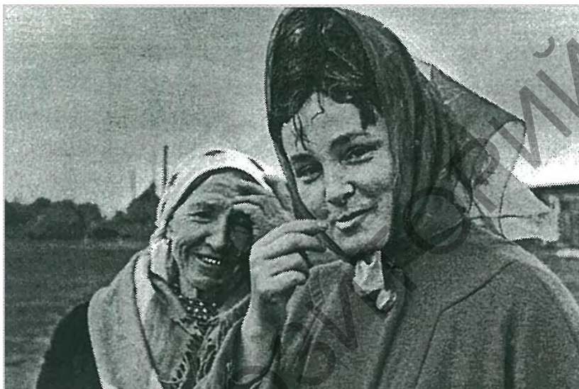
Малюнак 1 – Зінаіда Мажэйка з майстрыхай палескіх тонежскіх спеваў Ганнай Венгурай, 1970-я.

Напярэдадні сённяшняй канферэнцыі, 14 сакавіка бягучага года ў Беларускам дзяржаўным ўніверсітэце культуры і мастацтваў адбыўся «круглы стол», прысвечаны памяці беларусазнаўца, этнамузыкалага і аўдыявізуальнага антрапалага Зінаіды Мажэйкі (мал. 1). Кола пытанняў, што ўзнімалі яго арганізатары (прадстаўнікі ўніверсітэта культуры і мастацтваў, Беларускага дзяржаўнага ўніверсітэта, Беларускай дзяржаўнай акадэміі музыкі, Нацыянальнай акадэміі навук Беларусі, Студэнцкага этнаграфічнага таварыства, калегі і сябры даследчыцы) было наступным: навуковая спадчына даследчыцы; захады па ўшанаванні яе памяці; сучасны стан этнічнай культуры беларусаў і захаванне экалогіі традыцыйнай культуры паводле навуковага тэстаменту Зінаіды Мажэйкі. Тое, што прадстаўнікі абсалютна розных навуковых, адукацыйных і грамадскіх устаноў сабраліся разам менавіта па вышэйназванай нагодзе, падаецца заканамерным, сімвалічным і надта своечасовым. Асабліва своечасовай бачыцца сустрэча, згаданая вышэй, калі «ўзважыць»: спецыфіку ўнёску нашай вядомай суайчынніцы ў беларусазнаўства і сусветную навуку; яе асабістыя якасці і жыццёвае крэда; а таксама сучасны стан аб'екта яе навуковых і грамадскіх інтарэсаў, якому была цалкам прысвечана ўсё жыццё – сучасны стан традыцыйнай культуры беларусаў.