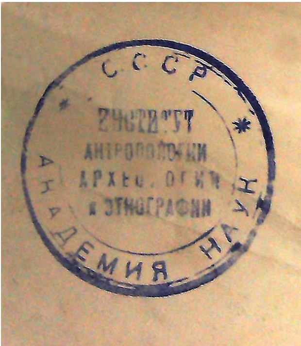
Малюнак 3 – Пячатка Інстытута антрапалогіі археалогіі і этнаграфіі на беларускіх матэрыялах Я.Гіпіуса, 1930-я.