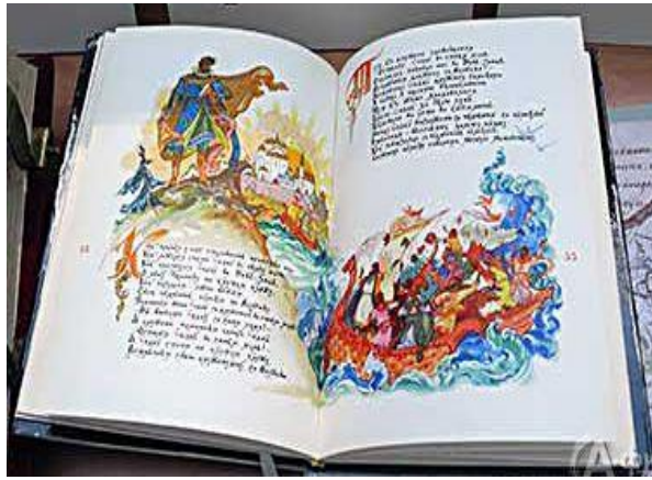
Рисунок 3 – Иллюстрации Бориса и Калерии Кукулиевых к миниатюрному изданию «Садко» (Москва: Худож. лит., 2000; 72x100 мм)

Миниатюрные книги, в которых для иллюстрирования использованы художественные работы авторов литературных текстов, немногочисленны. Тем не менее, именно этот художественный прием позволяет читателю более глубоко заглянуть в духовный мир автора книги, постичь многогранность его творческого дарования.