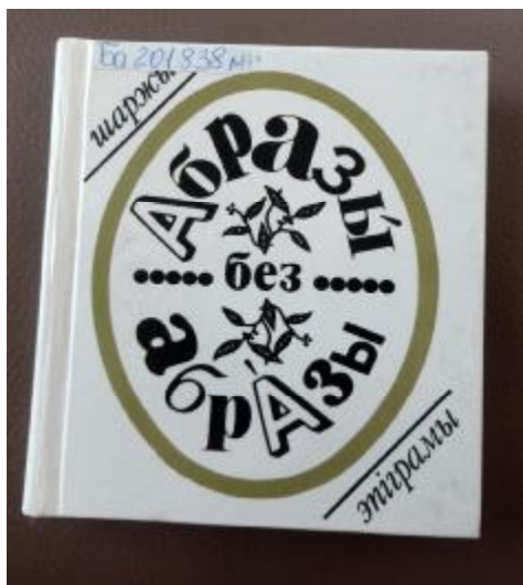
Рисунок 1 – Миниатюрное издание «Абразы без абразы: сяброўскія шаржы і эпіграмы» (Мінск : Маст. літ., 1985; 75x94 мм)