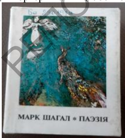
Рисунок 4 – Миниатюрное издание М. Шагал «Паэзія» (Мінск : Маст. літ., 1989; 76x97 мм)

Среди миниатюрных изданий обозначенного вида, на наш взгляд, заслуживает внимания книга М. Шагал «Паэзія» (Мінск: Маст. літ., 1989; 76x97 мм). Данный сборник составили стихи М. Шагала о Витебске, родном крае, дорогих художнику людям в переводе с языка идиш Г. Бородулина (на белорусский язык) и Л. Беринского (на русский язык). Фронтиспис издания украшен «фотопортретом» рук гениального живописца, а также его автографом (рис. 4, 5). Шагаловскую поэзию иллюстрируют репродукции его знаменитых картин: «Портрет моей невесты» (1909), «Витебск, синий дом» (1920), «Моя деревня» (1923–1924), «Юнона и павлин» (1926–1927), «Голая над Витебском» (1933), «Портрет Вавы» (1955–1956) и др. (рис. 6, 7).