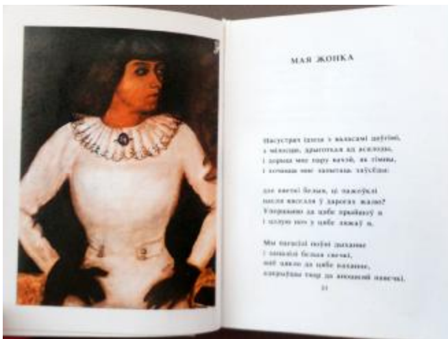
Рисунок 6 – Иллюстрация к миниатюрному изданию М. Шагал «Паэзія» (Мінск : Маст. літ., 1989; 76x97 мм)