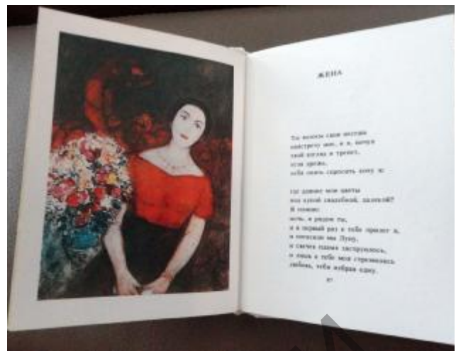
Рисунок 7 – Иллюстрация к миниатюрному изданию М. Шагал «Паэзія» (Мінск : Маст. літ., 1989; 76x97 мм)

Для художественного оформления трехтомного издания М.Ю. Лермонтова «Избранное» (Ставрополь: Кн. изд-во, 1977; 69x94 мм), объединенного в одном миниатюрном футляре, создатели книги также использовали живописные работы самого автора.