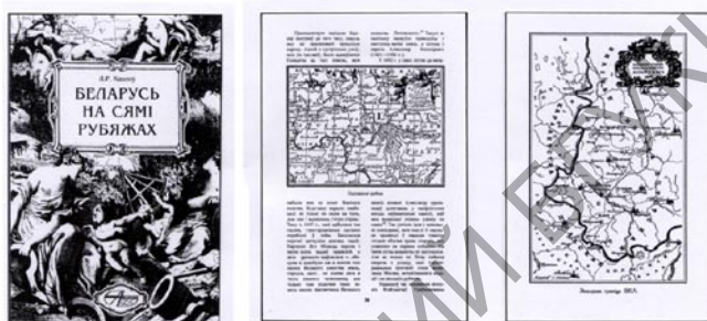
Першая кніга са старажытнай картаграфіяй Беларусі

бяхах” (Мн., 2000). У кнізе на падставе картаграфічных матэрыялаў быў паказаны амаль тысячагадовы працэс складвання будучай тэрыторыі Беларусі, вызначаны тэа часткі сучасных межаў, якія ніколі не мяняліся — сваеасаблівыя “крайвугольныя камяні”, што сфарміравалі яе сёняшні абрыс. У гэтую “сямёрку” увайшлі: “Літоўскае сумежжа”, “Лівонская граніца”, “Пскоўская мяжа”, “Смаленскі край”, “Северская старана”, “Палеская ўскраіна” і “Падляшскі рубез”. Усе пазначаныя межы адлюстроўваліся адпаведнымі картаграфічнымі фрагментамі.