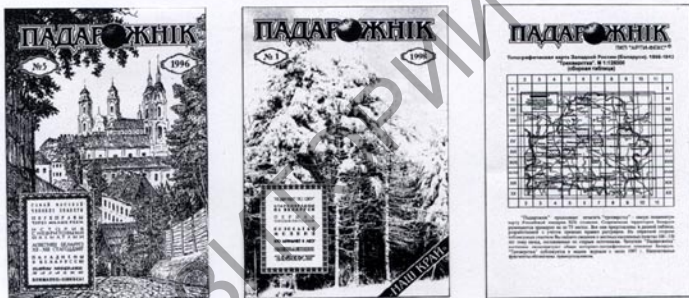
У “Падарожніку” друкаваліся старажытныя карты

У пачатку бягучага тысячагоддзя былі таксама падрыхтаваны да друку і іншыя агульнаадукацыйныя атласы – старажытнага свету, для старшых класаў сярэдняй школы і інш. Але па эканамічных ды іншых прычынах гэта праца была спынена.