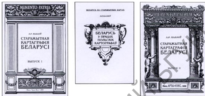
Чарговыя выданні па гісторыі старажытнай картаграфіі

выпускаў, у які ўвайшлі творы Г. Меркатара, Н. Сансона, А. Шатэле-на, І. Няпрэцкага, Б. Фаліна, В. Пядышава і інш. Да друку падрыхта-ваны і другі выпуск з гэтай серыі, у якім прадстаўлены такія картаг-рафічныя знакаматасці, як К. Пталемей, М. Бенявенцкі, С. Мюнстэр, Г. дэ Баплан, К. Аперман, В. Хшаноўскі, І. Стральбіцкі. Рыхтуецца таксама змест кнігі “Беларусь у працах расійскіх картографу”.