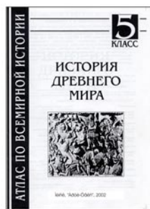
Першыя адукацыйна-асветніцкія публікацыі УП “Арты-Фэкс”