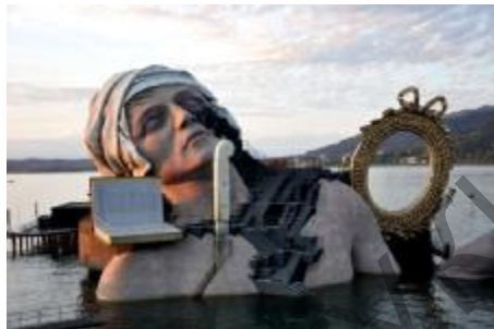
Рис. 2. Декорации к опере У. Джордано «Андре Шенье» (2011). Брегенцкий оперный фестиваль на Боденском озере (Австрия). Режиссер Д. Паунтни, художник Д. Филдинг

Границы репрезентации артефактов постоянно раздвигаются, поэтому репрезентирована может быть уже не только картина или скульптура, не только бытовой предмет или фильм, но и любая художественная акция. Современное искусство является пограничной областью становления новой реальности, где становление требует радикальных по типу творчества усилий, где меняются традиционная форма и концепция искусства, сущность произведений искусства и способы его бытования. Массовое промышленное воспроизведение предметов искусства привело к утрате подлинности как неперемного условия для существования произведений искусства в качестве такового.