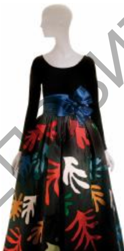
Рис. 5. Коллекция «Анри Матисс». Дизайнерский дом «Yves Saint Laurent»