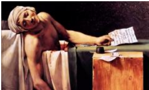
Рис. 1. Ж.-Л. Давид. Смерть Марата

его в состояние внешней пассивности, обнаружила неисчерпаемый потенциал для манипулирования человеческим сознанием. Перепроизводство визуальных образов, их массовая воспроизводимость привели к переизбытку собственно образов и их ползнаковости.