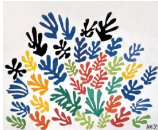
Рис. 6. А. Матисс. Уроки рисования

Одним из типов копирования в современной художественной культуре является ремейк (англ. remake – переделка – новая версия известного художественного произведения: романа, спектакля, ранее снятого фильма) в широком смысле слова. Он стал одним из способов воспроизводства современного искусства. Диапазон представления ремейка в искусстве до-