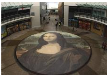
Рис. 4. «Мона Лиза» Л. да Винчи на полу в торговом центре «Eagles Meadow» (Лондон) из 82 принтов винила (2010). Площадь 240 кв. м