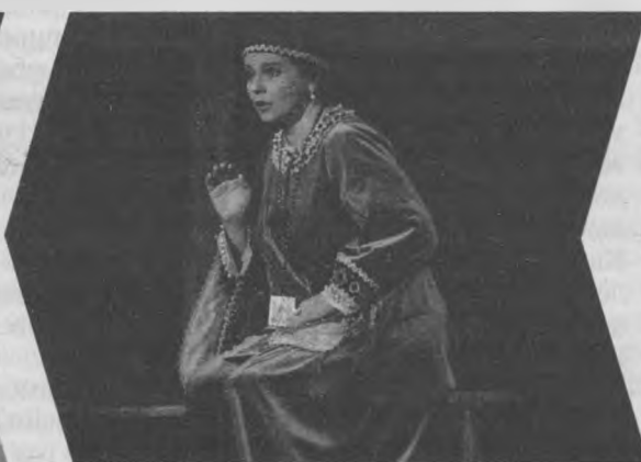
Прэм'ера оперы "Князь Ігар" А. Барадзіна