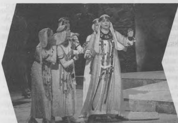
У ролі Купавы ў оперы "Снягурка" М. Рымскага-Корсакава, Вялікі тэатр

У 2010-м дэбютавала на сцэне Вялікага тэатра Расіі ў партыі Разалінды ў прэм'еры оперы "Лятучая мыш" І. Штрауса. Там жа спявала ў спектаклях "Снягурка" М. Рымскага-Корсакава, "Вішнёвы сад" Ф. Фенелона. У Маскоўскай філармоніі выступіла ў оперы "Аберон" К. М. Вэбера, а таксама з'яўлялася на сцэне Санкт-Пецярбургскай філармоніі.