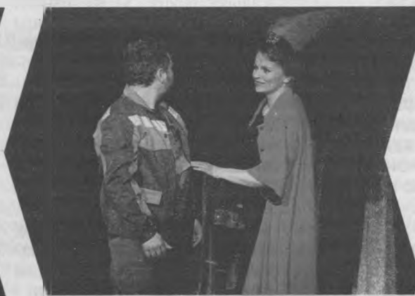
У ролі Неды ў оперы "Паяцы" Р. Леанкавала