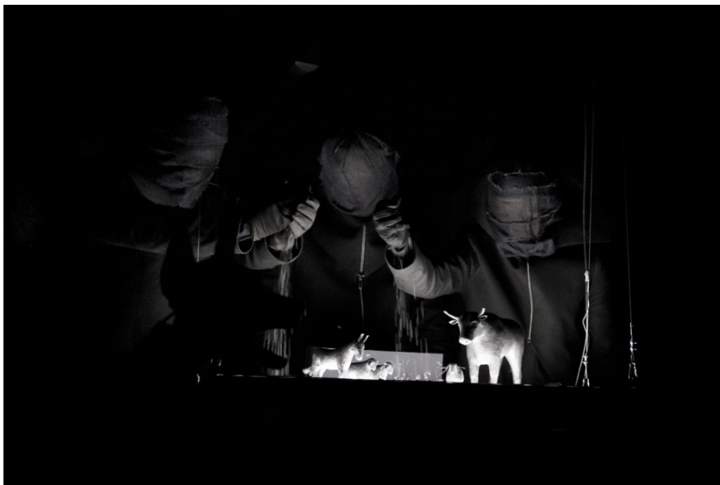
Рис. 1. Фото спектакля «Пачупкі». Республиканский театр белорусской драматургии. 2022 г.

Аудиальное восприятие в спектакле подчеркивается одно-тонным черным фоном, герои – актеры-исполнители – все обезличены, узнать их можно только по голосу (рис. 1, 2).