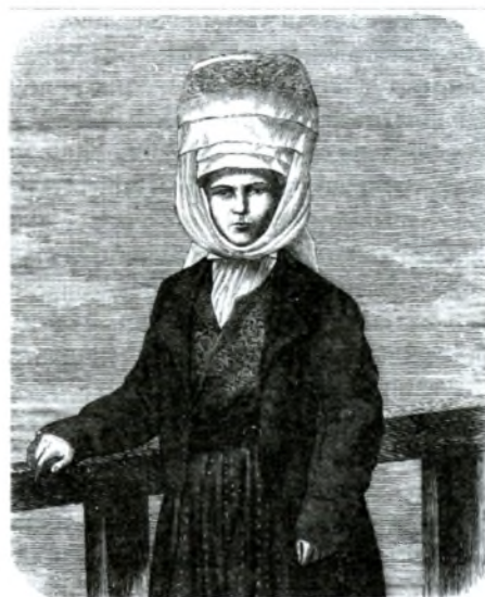
Мяшчанка з Давыд-Гарадка. Гравюра А.Рагульскага (Tygodnik Ilustrowany. 1863. № 197. S. 260—263).

Публікацыі ў польскай прэсе прыцягнулі грамадскую ўвагу да экзатычнага палескага галаўнога ўбору, паспрыялі яго далейшаму вучэнню і музеефікацыі. У 1898 г. палкоўнік расійскай арміі Валянцін Аляксандравіч Машкоў (1852—1922) з вандроўкі на Беларускуе Палессе прывёз у Кунсткамеру ў Санкт-Пецярбургу некалькі ўзораў такіх галаўных убораў. Яны за-