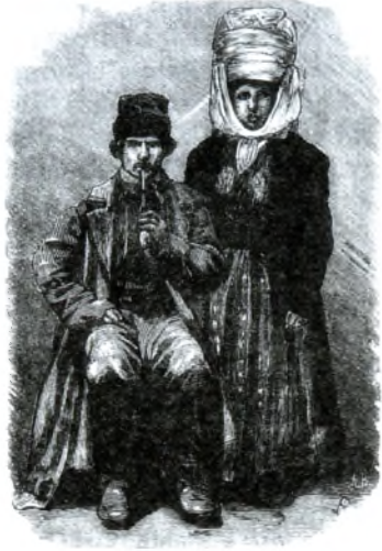
Тыпы мяшчан з Давыд-Гарадка.

Гравюра Падбельскага (Живописная Россия: Отечество наше... Москва, 1882. Т. 3. Ч. 1. С. 349).