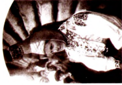
“Дзвіні строй у вёсцы Альшаны” 1925 г.

Каркас жаночага рагацістага галаўнога ўбору — “галава”, “дзюба” (палатно, бяроза, чарот) — з вёскі Цераблічы Столінскага раёна Брэсцкай вобласці.