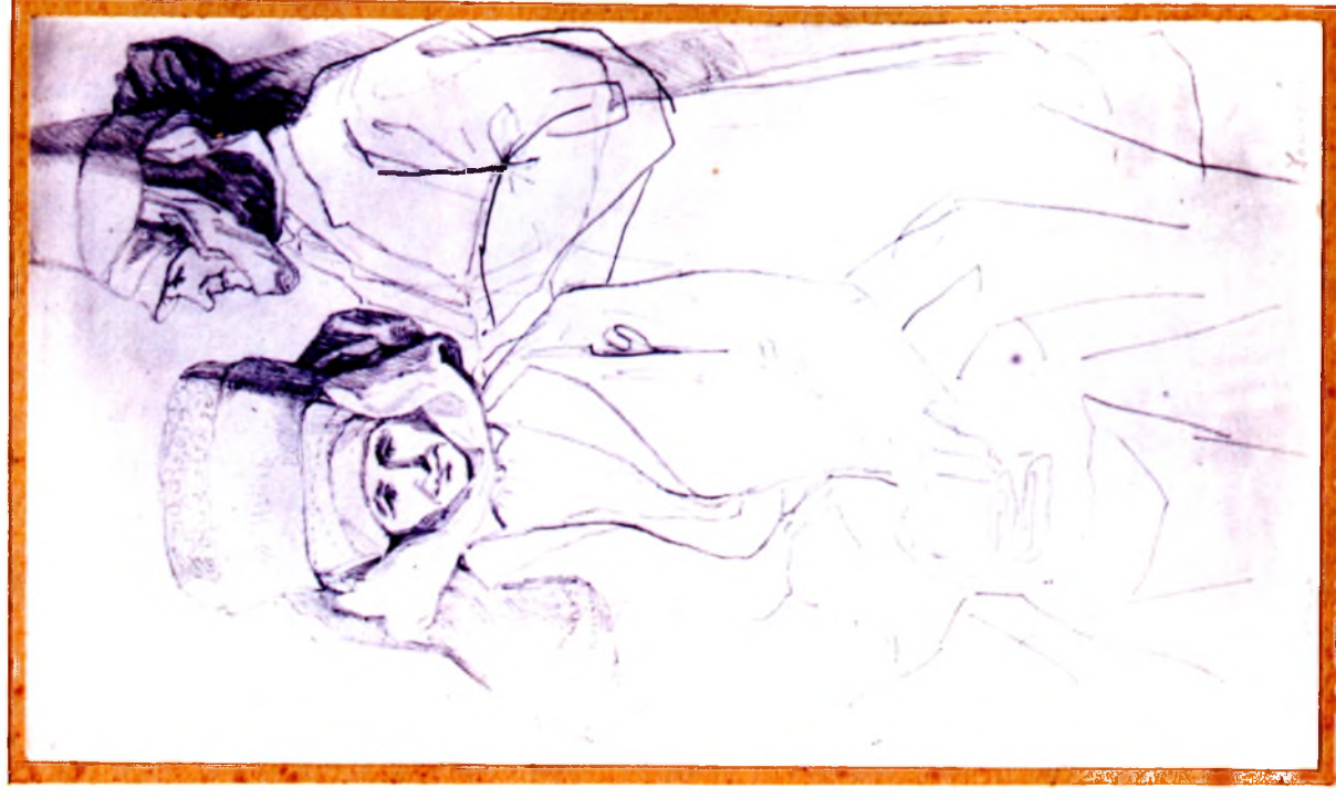
Сялянкі з ваколіц Давыд-Гарадка. Малюнак Хелены Скірмунт. 1855 г. Музей Беларускага Палесся ў Пінску (кп14822, ф1 -2407/49).