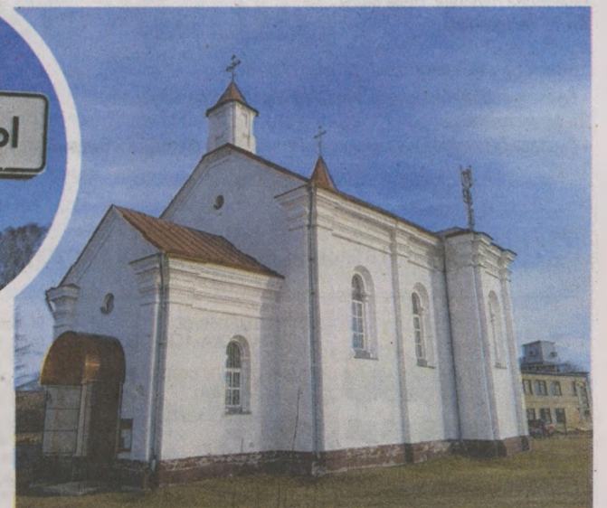
Касцёл Найсвяцейшай Дзевы мары Ружанцовай, XVII ст., Гарадзішча