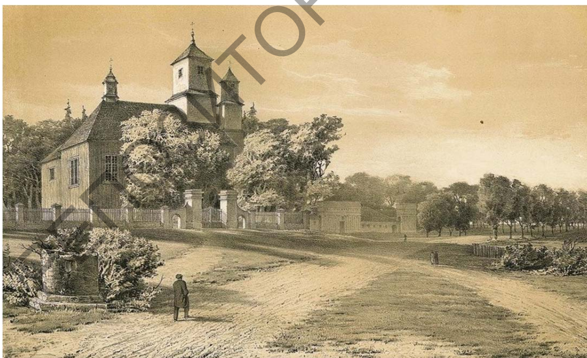
Рис. 1. Костел и Свислочская гимназия. Наполеон Орда, 1875–1882 гг.