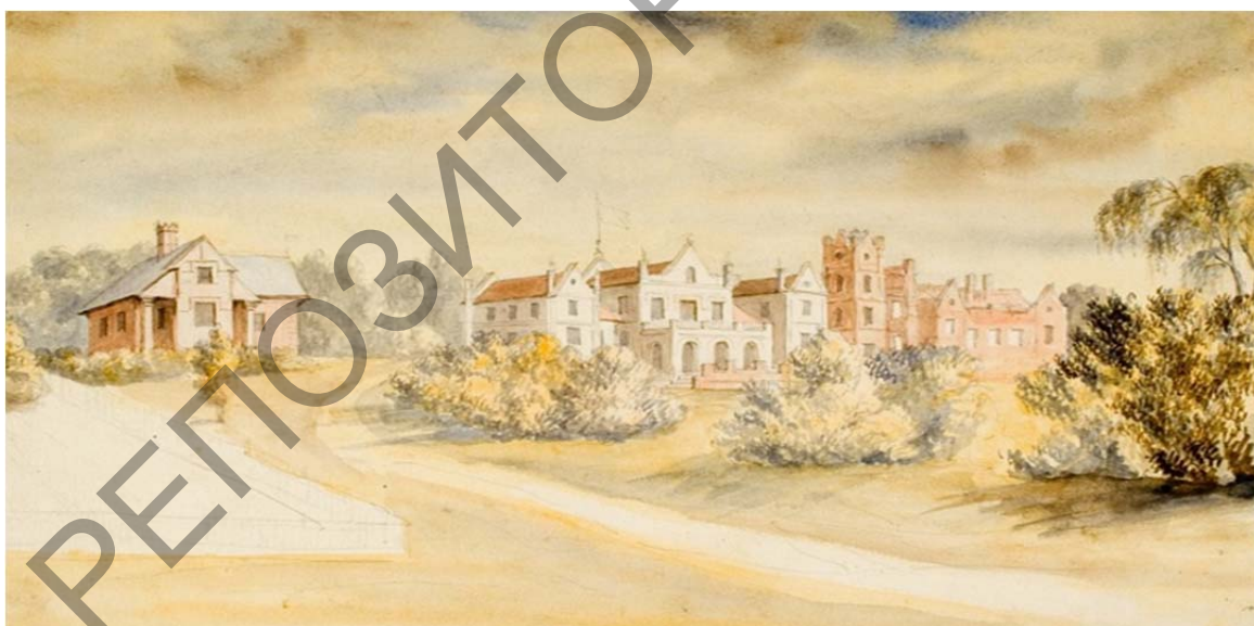
Рис. 4. Резиденция Тышкевичей в Острошицком Городке. Наполеон Орда, конец XIX в.

дворцово-парковый комплекс существует сегодня лишь в карандашно-акварельной зарисовке художника (рис. 4). Судя по изображению Н. Орды, главной постройкой был деревянный дворец, расположенный на возвышенности и объединяющий ряд жилых и хозяйственных построек. Наибольший расцвет поселение приобрело в середине XIX в. при Михаиле Иосифовиче Тышкевиче и его супруге Марии Николаевне, однако, в отличие от Логойска или Воложина, не имело такого общественно-культурного резонанса. Владения Тышкевичей в Острошицком Городке включали графское поместье, приблизительно 37 дворов, где проживало около 430 жителей, а также деревянную униатскую церковь и синагогу, сукновальню, завод по производству кирпичей, бровар [4]. Кроме того, малочисленные снимки из виртуального музея Логойска и письменные архивные данные свидетельствуют о том, что в Острошицком Городке располагались регулярный парк, озеро с каскадом прудов и перекидной мост. К сожалению, архитектурный ансамбль был разрушен и в настоящее время о нем практически ничего не известно.