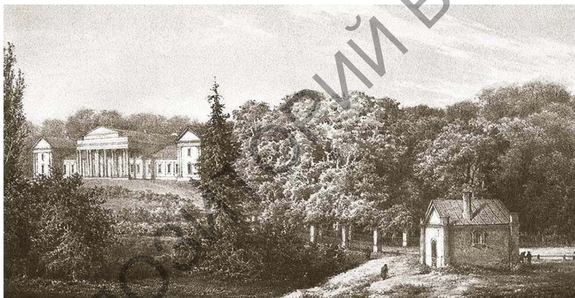
Рис. 2. Дворец Тышкевичей в Логойске. Наполеон Орда, 1856–1883 гг.

сооружения была обустроена большая парковая зона, которая органично дополнила гористый ландшафт Логойска. Наполеон Орда изобразил Логойский замок Тышкевичей, подчеркнув органичное взаимодействие природного и культурного начала, воплотившееся в архитектурном ансамбле. Дворец утопает в зелени и как бы осторожно выглядывает из-за деревьев (рис. 2). Визуализация Н. Орды лишена пафоса, она, скорее, подчеркивает интеллектуальный размах личности владельца, его благородство и стремление к единению с природой. Это важный момент, так как внутренне убранство дворца выглядело совсем иначе – роскошные залы в стиле ампир, демонстрирующие раритетные экземпляры из богатой коллекции графского рода, фамильная галерея, библиотека, большие гостиные для светских мероприятий и др.