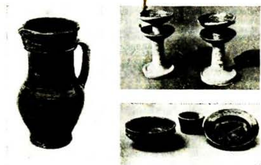
Магілеўская кераміка. Збан. 17—18 ст. (злева); свяцільні. 18—19 ст. (уверсе справа); посуд. 17—18 ст.

МАГІЛЕўСКАЯ КЕРАМІКА , традыцыйныя вырабы мясцовых рамеснікаў канца 15—пач. 20 ст.: посуд, цацкі і інш. прадметы хатняга