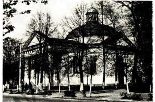
Лідскі Іосіфаўскі касцёл піяраў.

ЛІДСКІ ІОСИФАЎСКІ КАСЦЁЛ ПІЯРАЎ , помнік архітэктуры канца 18 — 1-й пал. 19 ст. Пабудаваны ў 1797—1825 у Лідзе ў стылі класіцызму. Мураваны храм-ратонда накрыты паўсферычным купалам, завершаным 8-гранным ліхтаром. Да асн. круглага ў плане аб'ёму прылягаюць больш нізкія прамавугольныя ў плане аб'ёмы: па восі У—З — прытвор з 4-калонным порцікам на гал. фасадзе і 2-павярховая сакрысцыя, з Пд і Пн — невял. рызаліты.