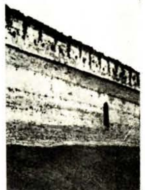
Лідскі замак. Акварэль І. Пешкі канца 18 ст. (злева), фрагмент сцяны (здымак канца 19 ст.).