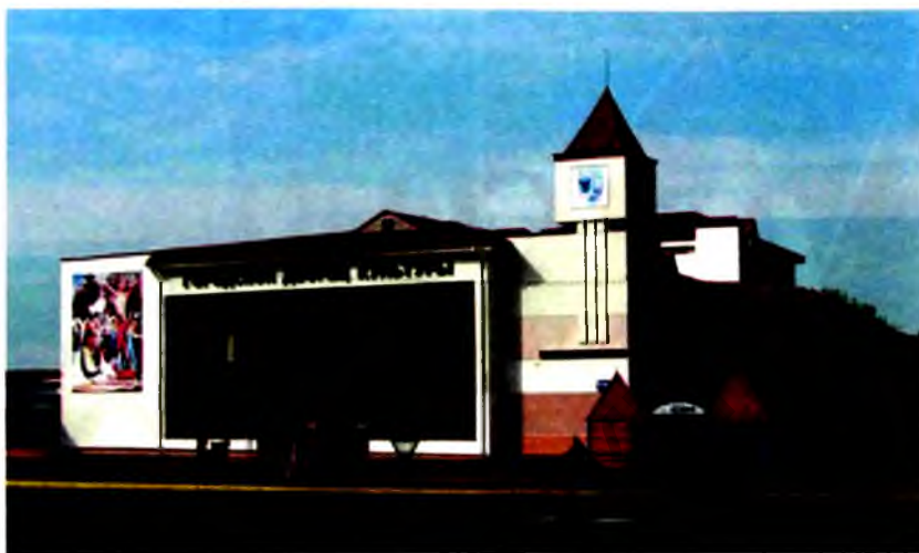
Гарадскі Палац культуры ў г. Мазыр.

Мяркуецца, што слав. паселішча, ад якога бярэ пачатак М., узнікла ў