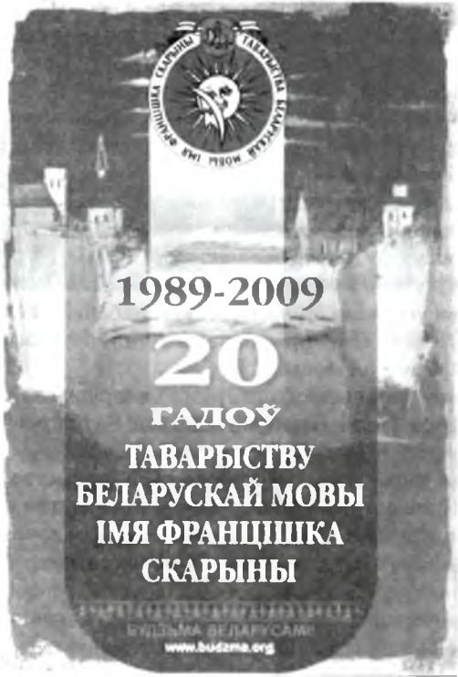
Каляндарык, прысвечаны 20-годдзю Таварыства беларускай мовы.