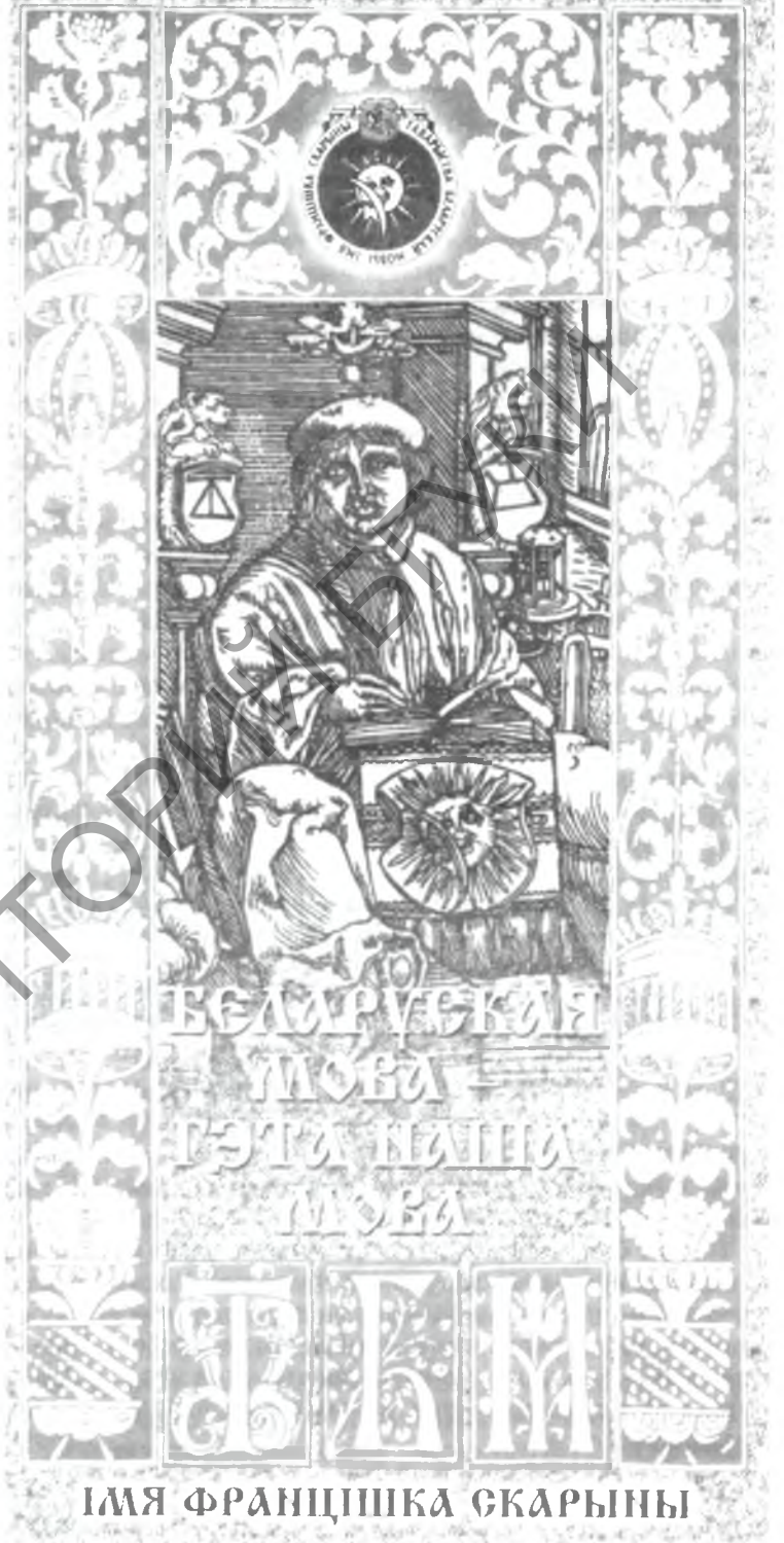
Буклет Таварыства беларускай мовы.