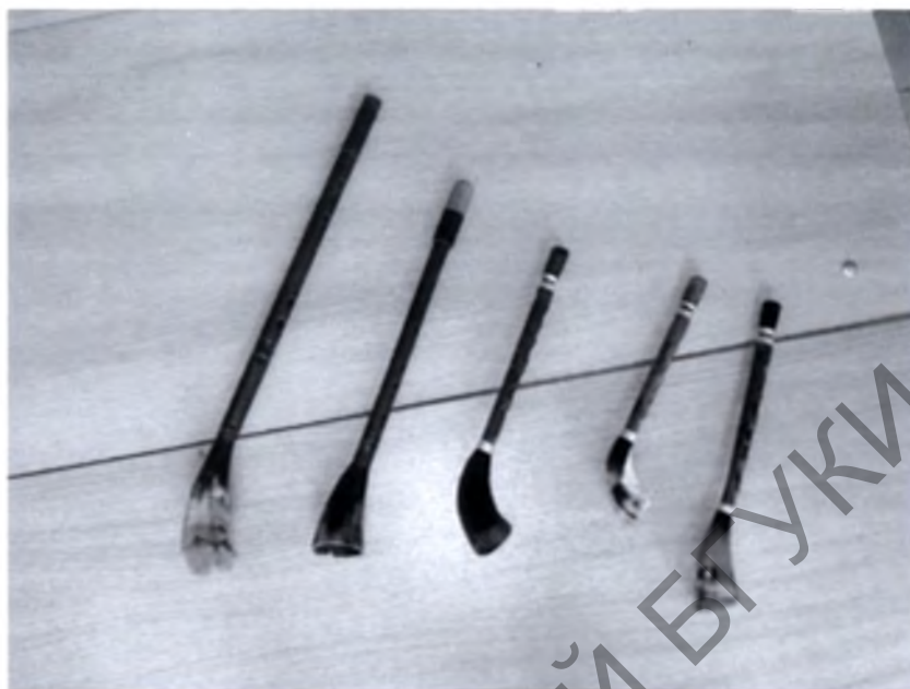
Фото белорусских язычковых или лингвальных инструментов – разновидности жалеек.