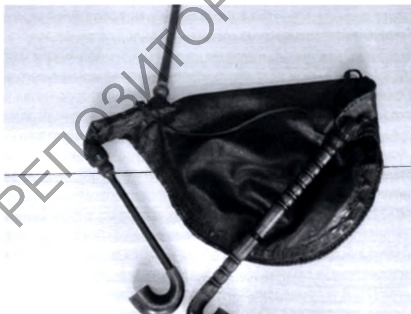
Фото уникального традиционного белорусского язычкового или лингвального инструмента – дуды.