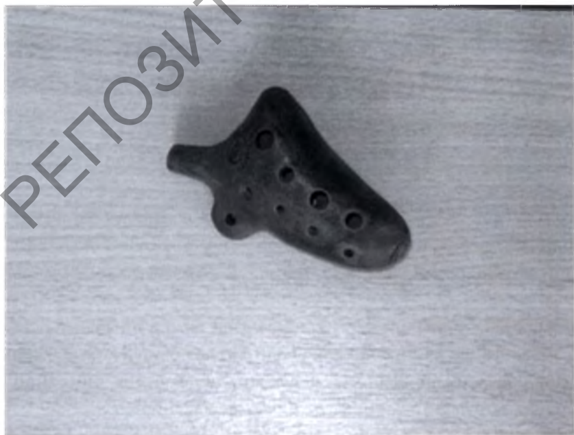
Фото белорусского лабиального инструмента – окарины.

Дудка-бас in "c". Звуки нотируются по фактическому звучанию. Диапазон от до 1 до ля 2 ( си 2 ). Размер у басовой дудки гораздо больше, чем у других дудок: увеличен игровой ствол и расстояние между игровыми отверстиями, свистковое устройство довольно широкое. Исполнитель на такой дудке должен обладать длинными пальцами: для закрытия игровых отверстий. Из-за этого в техническом плане дудка совсем неподвижна. Тембр у басовой дудки – тихий, матовый, с некоторым эффектом завывания.