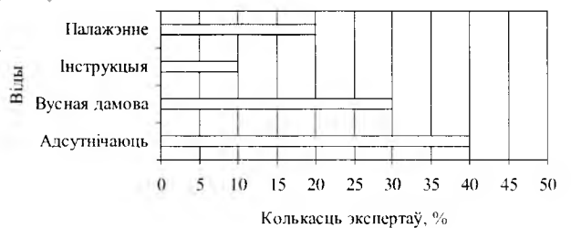
Схема 3 Вызначэнне экспертамі відаў інструктыўна-метадычных і нарматыўных дакументаў, якія рэгламентуюць ўзаемадзеянне НББ і рэспубліканскіх бібліятэк у галіне фарміравання фондаў

Экспертам было прапанавана размеркаваць па ступені значнасці формы абмеркавання пытанняў ўзаемадзеяння. З табліцы 1 відаць, што формай першага рангу, якая атрымала найбольшую колькасць галасоў (15), стала Пасяджэнне Камітэта па бібліятэчных фондах Беларускай бібліятэчнай асацыяцыі. Формай другога рангу – круглы стол, формай трэцяга рангу – Рэспубліканская нарада і формай чацвёртага рангу – Рэспубліканская канферэнцыя. Па меркаванні некалькіх экспертаў, акрамя азначаных форм, павінны праводзіцца пасяджэнні Рэспубліканскай міжведамаснай рады і вытворчыя нарады супрацоўнікаў бібліятэк, якія займаюцца фарміраваннем фондаў. Атрыманыя адказы дэманструюць адрозненні ў поглядах экспертаў.