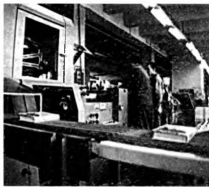
Да арт. Мінскі паліграфічны камбінат. Пераплётны цэх.