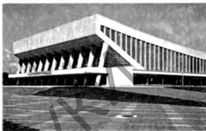
Мінскі палац спорту.

МІНСКІ ПЕДАГАГІЧНЫ КАЛЁДЖ . Засн. ў 1983 у Мінску як Мінскае пед. вучылішча № 2. З 1993 сучасная назва. Спецыяльнасці (1999/2000 навуч. г.): выкладанне ў пач. класах; пазакласная і пазашкольная выхаўчая работа (для навучэнцаў з недахопамі слыху); выкладанне бел. мовы і л-ры ў базавай школе, выкладанне замежнай мовы (ням. і англ.) у базавай школе. Прымаюцца асобы з базавай і сярэдняй адукацыяй. Навучанне дзённае.