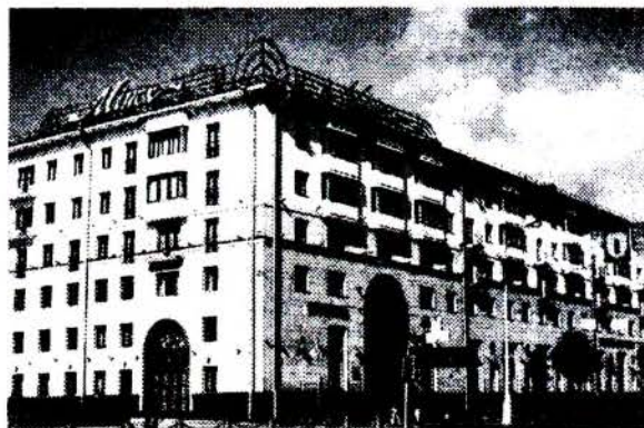
Рис. 2. Гостиница «Минск», место расположения аукционного дома «Paragis». 2017