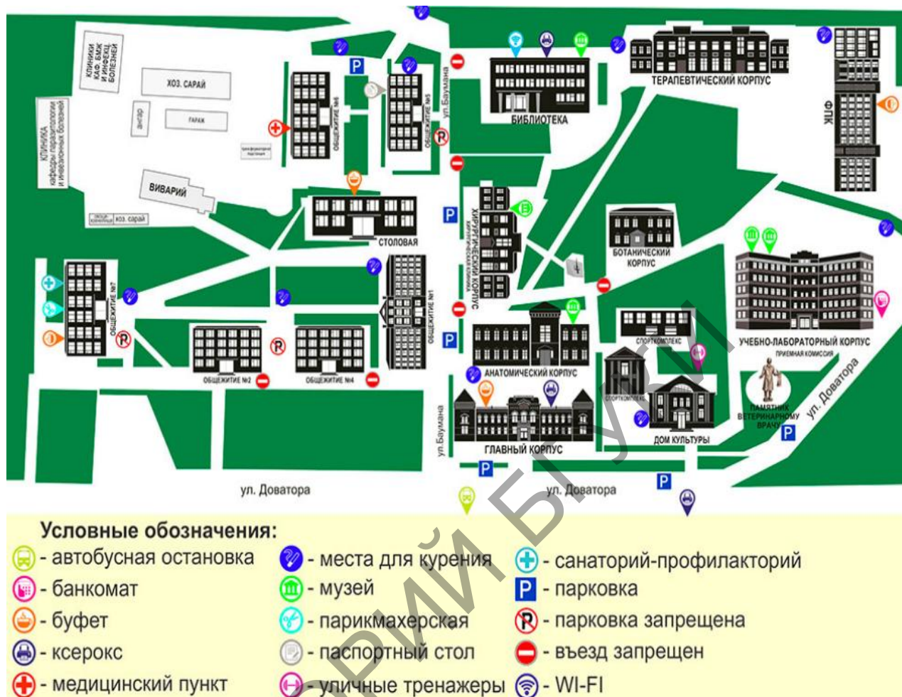
Рисунок 1 – Карта академического городка Академии ветеринарной медицины

В академическом городке происходят внутрикорпоративные связи, обеспечивающие распространение информации между различными группами студентов, слушателей, работников и профессорско-преподавательским составом в результате чего, все участники взаимодействия реализуют миссию и политику ВУЗа.