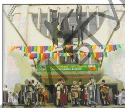
Малюнак 1 – Вокладка выдання «Я – грамадзянін Рэспублікі Беларусь», якое ўрачыста ўручаюць беларускай модадзі і фатаздымак капэлы «Гуды» з гэтага выдання

Мэта артыкула – прасачыць змены ў этнамастацкай адукацыі Беларусі пачатку XXI ст., абумоўленыя патрэбай яе еўразійскай і еўраінтэграцыі з захаваннем нацыянальна-культурнай адметнасці – неабходнай умовы «імунітэту» ад бескантрольнай глабалізацыі . Ідэя пра тое, што нацыянальная культура, фальклор – культурная спадчына Беларусі і дзейсны сродак патрыятычнага і этнакультурнага выхавання сёння ўсё больш актыўна выкарыстоўваецца дзяржавай. Так, з 2007 г., разам з пашпартам 16-гадовым беларусам уручаюць выданне з мультымедычным дадаткам [4], дзе сярод фота шэдэўраў нацыянальнай культуры – фатаздымак дудароў (выканаўцаў на беларускай валынцы – адным з этнічных маркераў нашага музычнага фальклору з XVIII ст.) капэлы «Гуды» (малюнак 1). У сучасным вузкаспецыялізаваным грамадстве кожным відам дзейнасці займаюцца мэтанакіравана падрыхтаваныя асобы. Працаваць з аўтэнтчным фальклорам («жывым» этнамастацтвам, якое і з’яўляецца 100 %-й нематэрыяльнай культурнай спадчынай) у вышэйшай школе пачалі нядаўна. Адзін з першых досведаў у Беларусі – кафедра этналогіі і фальклору БДУКМ (2003). Яе дзейнасць канцэптuallyная і выпрацоўвае адукацыйныя мадэлі для вышэйшай школы, якія б спрыялі захаванню і ахове кара-