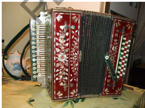
Рисунок 1 – Гармонь «хромка» 25X25

Характерный для Молодова способ оформления заголовка — более жирная обводка фрагмента текста к нотам, связанная с отдельными словами , часто служебными (далее фрагменты текста, заключенные в квадратные скобки, означают, что они не были выделены автором в качестве заголовка): «А я [по лугу]»; «Вот [кто-то с горочки спустился]», «Что [ты белая береза]», слоганы : «Ка[линка] Ка[линка]», «Ве[черний звон]» и даже буквами : «Л[ипа вековая]», что позволяло автору свода легко ориентироваться в письменном тексте. Еще одним способом упростить работу по тетрадям стал для Молодова прием графического отделения нотировок с помощью горизонтальных и диагональных линий, особенно эффективный в тех случаях, когда названия песен не выделялись и не выписывались (последнее обстоятельство позволяет предположить, что эти образцы были менее востребованы гармонистом в процессе самообучения).