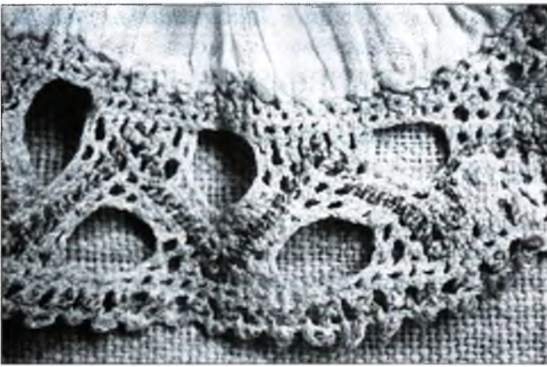
Фрагмент рукава жаночай кашулі з вёскі Бучаціна Капыльскага раёна. Лен, карункі на каклюшках. Нацыянальны гістарычны музей Рэспублікі Беларусь.

узнятую ўверх. Такі спосаб упрыгожвання рукавоў жаночых кашуль у мяшчанскім і сялянскім строях на Случчыне выяўляе іх блізкасць да моднага касцюма заходнееўрапейскай эліты XVII ст. На жаночых партрэтах мастакоў Нідэрландаў і Англіі таго часу можна бачыць менавіта такі спосаб упрыгожвання рукавоў карункамі, што былі ў вялікай модзе. Гэтае супастаўленне дае нам падставу меркаваць, што мяшчанскае і сялянскае саслоўе запазычыла падобную аздобу з касцюма беларускіх эліт, якія ў XVII ст. разам з прыняццем модных узораў заходнееўрапейскага касцюма прыўнеслі на Беларусь і рамяство пляцення карункаў. Пацвярджае гэта і багатая гісторыя Семежава. Мястэчкам валодалі магнаты Вялікага Княства Літоўскага і Рэчы Паспалітай князі Радзівілы. Семежава ўзнікла не пазней за XVI ст. і адносілася спачатку да Клецкай, а потым да Нясвіжскай ардынацыі Радзівілаў [24, s. 546]. Жыхары карысталіся чыншавым правам і былі вольныя ад паншчыны. Яны валодалі дастатковай колькасцю зямлі, што вылучала іх сярод насельніцтва іншых беларускіх мястэчак [23, с. 361]. Вёскі Бучаціна і Дзярэчын, адкуль паходзяць кашулі з карункамі, таксама ўваходзілі ў склад уладанняў Радзівілаў. Таму нельга выключаць, што радавод семежаўскіх карункаў можа быць звязаны з родам Радзівілаў, якія, сярод іншых культурных новаўвядзенняў, прывілі на беларускіх землях еўрапейскую моду на карункі і спрыялі распаўсюджванню гэтага рамяства.