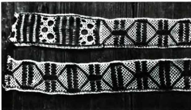
Карункавыя прошвы. Пачатак XX ст. Лен, карункі на каключках. Фотаздымак 1920-х гг. захоўваецца ў Нацыянальным гістарычным музеі Рэспублікі Беларусь.

У Семежаве нам не ўдалося знайсці жаночыя кашулі з карункамі. Разам з тым у музеях ёсць узоры кашуль з плеченымі карункамі, якія паходзяць з блізкіх да Семежава вёсак Бучаціна і Дзярэчын Капыльскага раёна. Карункі на рукавах гэтых кашуль па тэхніцы пляцення, матэрыяле, характары арнамента, пяцельчатым завяршэнні краю падобныя да карункаў на тэкстыльных прадметах, што дакладна выраблены ў Семежаве. Беручы пад увагу існаванне шлюбнай міграцыі семежаўскіх нявест і адпаведна – перамяшчэнне іх тэкстыльнага пасагу ў найбліжэйшыя вёскі, можна з вялікай доляй верагоднасці аднесці карункавыя ўпрыгажэнні гэтых кашуль да ўзораў семежаўскага карункапляцення. Варта адзначыць, што кашулі вылучаюцца асаблівымі спосабамі афармлення карункамі рукавоў, не характэрным для беларускага народнага касцюма. Звычайна ў сялянскіх кашулях карункі прышыты па краі рукава, апускаюцца і ўтвараюць фальбону вакол кісці рукі. Менавіта так афармлены рукавы кашуль з вёсак Казулічы Кіраўскага раёна, Дулебы і Капланцы Бярэзінскага раёна. У кашулях з суседніх з Семежава вёсак карункі нашыты вышэй ад абшыўкі і ўтвараюць пышную фальбону,