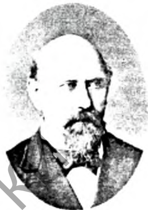
П.А.Бяссонаў у 1890-я гг.