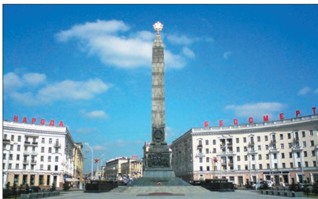
Рисунок 3. Монумент Победы

глая). Монумент увенчан изображением ордена Победы (рисунок 3).