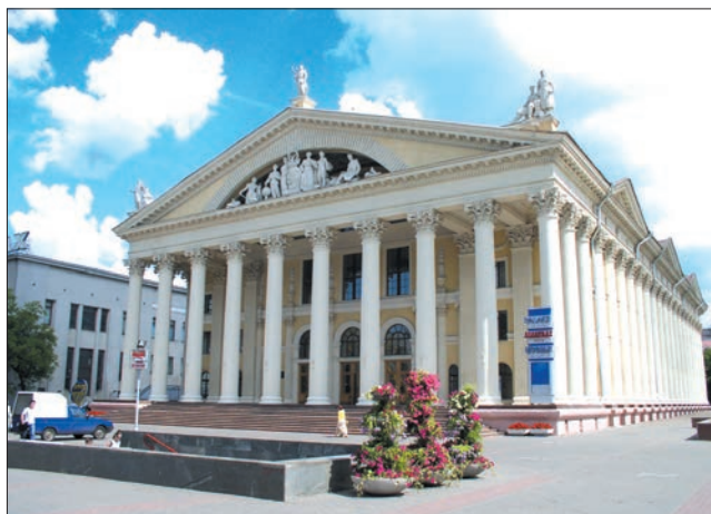
Рисунок 5. Дворец культуры Белострофа