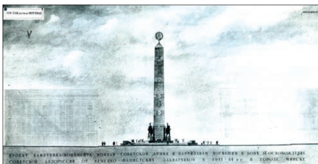
Рисунок 2. Технические проекты Монумента Победы (1950-е гг.)