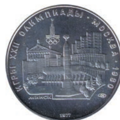
Рисунок 1. Реверс памятной монеты, посвященной Минску (серия «Летние Олимпийские игры 1980 г.». 1977 г., номинал 5 руб., серебро)

На реверсе монеты, посвященной Минску, размещен коллаж из нескольких архитектурных объектов, основное место среди которых отведено Монументу Победы, Дворцу культуры профсоюзов и Дворцу спорта (рисунок 1).