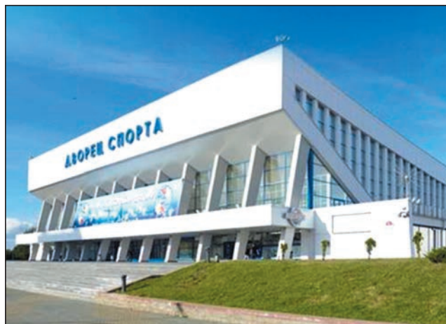
Рисунок 6. Дворец спорта. Минск

«2 категория» внесена в Государственный список историко-культурных ценностей Республики Беларусь [3, с. 630].