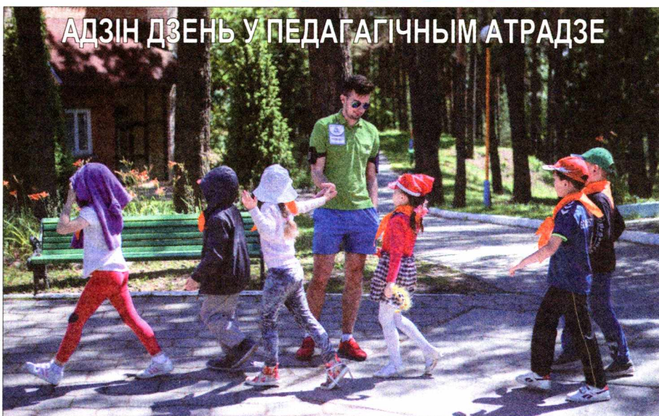
АДЗІН ДЗЕНЬ У ПЕДАГАГІЧНЫМ АТРАДЗЕ