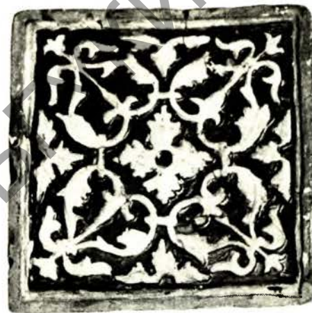
Паліхромная кафля (сценная). Канец XVI—пачатак XVII ст.

Паліхромныя кафлі дапамагаюць уявіць узровень мастацкага аздаблення старажытных інтэр'ераў і выкарыстаць гэтыя веды ў час рэстаўрацыі Мірскага замка.