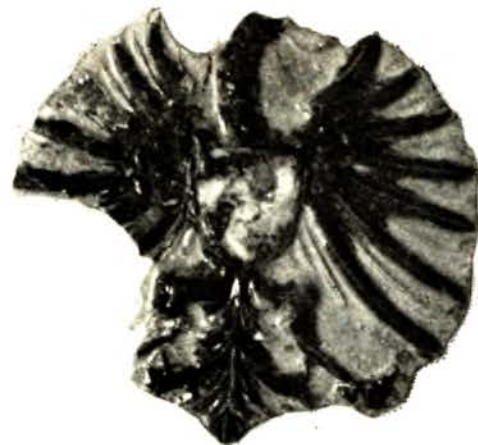
Кафля—медальён. Канец XVI—пачатак XVII ст.