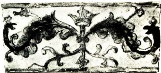
Паясовая кафля. Канец XVI—пачатак XVII ст.