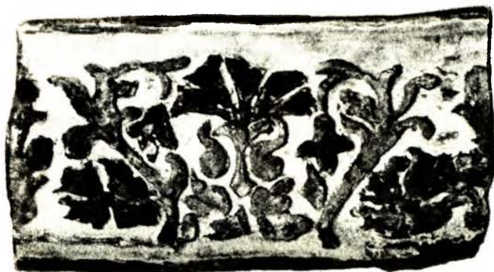
Карнізная кафля. Канец XVI—пачатак XVII ст.

пы з кіпцюрамі строга сіметрычныя. На грудзях — сіні шчыт з паляўнічымі рагамі — успамін пра паходжанне ад простага паляўнічага. Краі кафлі акрэслены жоўта-зялёнай рамкай. Агульны каларыт яркі, зычны.