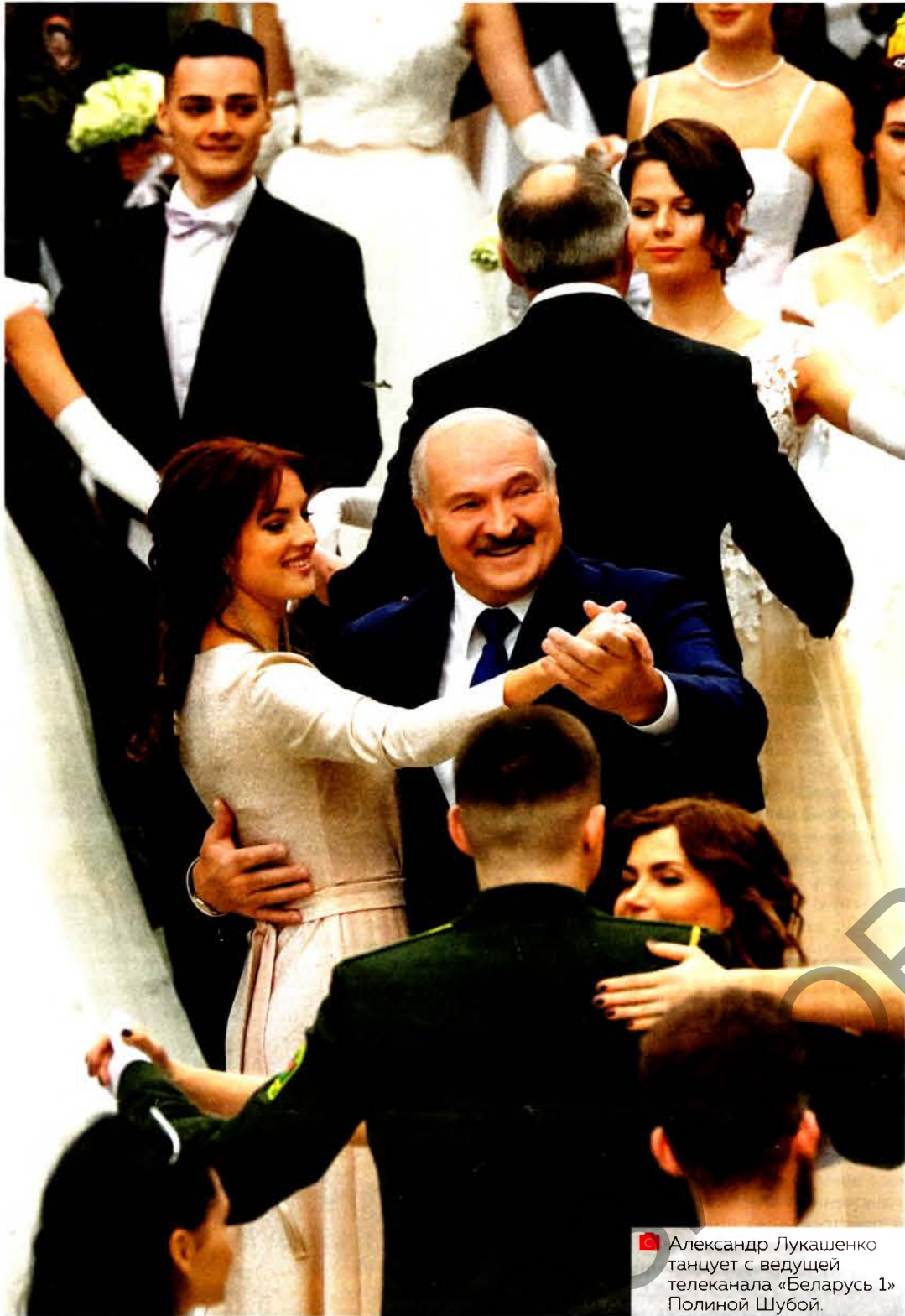
Александр Лукашенко танцует с ведущей телеканала «Беларусь 1» Полиной Шубой.

ВЫХОДИТ 5 РАЗ В НЕДЕЛЮ / ОБЩЕПОЛИТИЧЕСКАЯ ГАЗЕТА