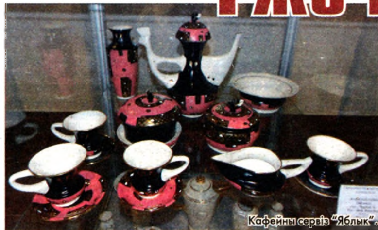
Кафейны сервіз "Яблык".