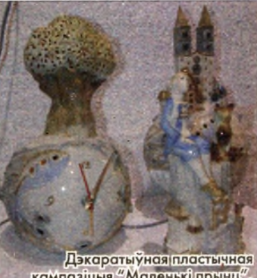
Дэкаратыўная пластычная кампазіцыя "Маленькі прынц".

Дарэчы, на выставу ў Мінск гжэльцы прывезлі не толькі кераміку, але і творы жывапісу, графікі,