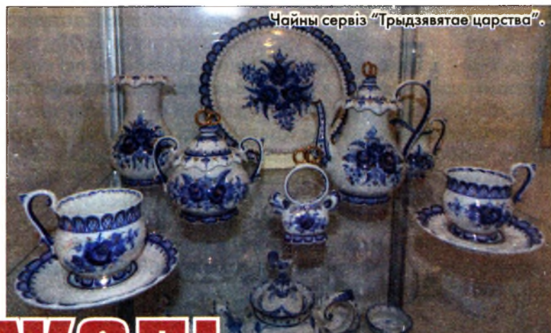
Чайны сервіз "Трыдзвятае царства".

дзе цар Аляксей Міхайлавіч выдаў указ "во гжельской волости для аптекарских и алхимических сосудов прислать глины, которая годится к аптекарским сосудам". 15 вазоў гжэльскай гліны было тады дастаўлена ў Маскву. Яе якасць ацаніў нават вялікі рускі вучоны Міхаіл Ламаносаў, якому належаць наступныя ўзвышаныя словы: "Едва ли есть земля самая чистая и без примешания где на свете, кою химики девственницею называют, разве между глинами для фарфору употребляемыми, такова у нас гжель-