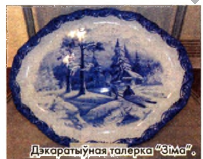
Дэкаратыўная талерка "Зіма".

прадукт з замежнай краіны, а менавіта брэндавае мастацтва. Расія ў свеце пазнаецца па гжэлі гэтак жа, як, напрыклад, па матрошцы, балалайцы, рускай лазні і г.д. Падругое, праз экспанаты, якія сёння выстаўлены ў галерэі, праяўляецца тая ўнікальная мастацкая адукацыя, якую атрымліваюць студэнты Гжэльскага дзяржаўнага ўніверсітэта. І, па-трэцяе, тут вельмі важны момант творчага супрацоўніцтва Гжэльскага дзяржаўнага