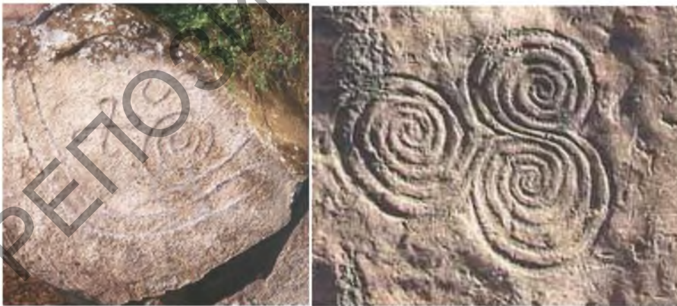
Рисунок 3, 4 – сокральные знаки в виде спиралей

В книге «АллатРа» А. Новых отмечается, что воздетые к небу руки означают «символ духовного освобождения, озарения, постижения Истины. Причём изначально его ставили в отношении духовно созревшей Личности независимо от того, женщина эта была или мужчина. Часто «руки» в данном знаке изображали символическим знаком Аллата, а «ноги» – в виде закрученных в разные стороны двух спиралей» (Рисунок 3, 4) [3, с. 396].