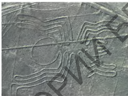
Рисунок 5 – сокральный знак в виде «жучка»

божественного женского начала). Спираль, закрученная по часовой стрелке, означала позитивные, созидательные духовные силы, а против часовой стрелке – отрицательные, разрушительные силы животного разума, противодействующие силам Аллата. В обозначениях духовных практик символы спиралей использовались в значении энергий или их соединения. Также спиралью в три с половиной оборота обозначали энергию, которую на Востоке до сих пор называют, спящей змеей Кундалини, символизирующей скрытый энергетический потенциал человека [3, с. 396].