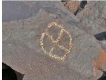
Рисунок 6 – Солярный знак в виде круга с разделением на сегменты

вписанными внутрь крестом или разделенные, как колеса, на сегменты (Рисунок 6).