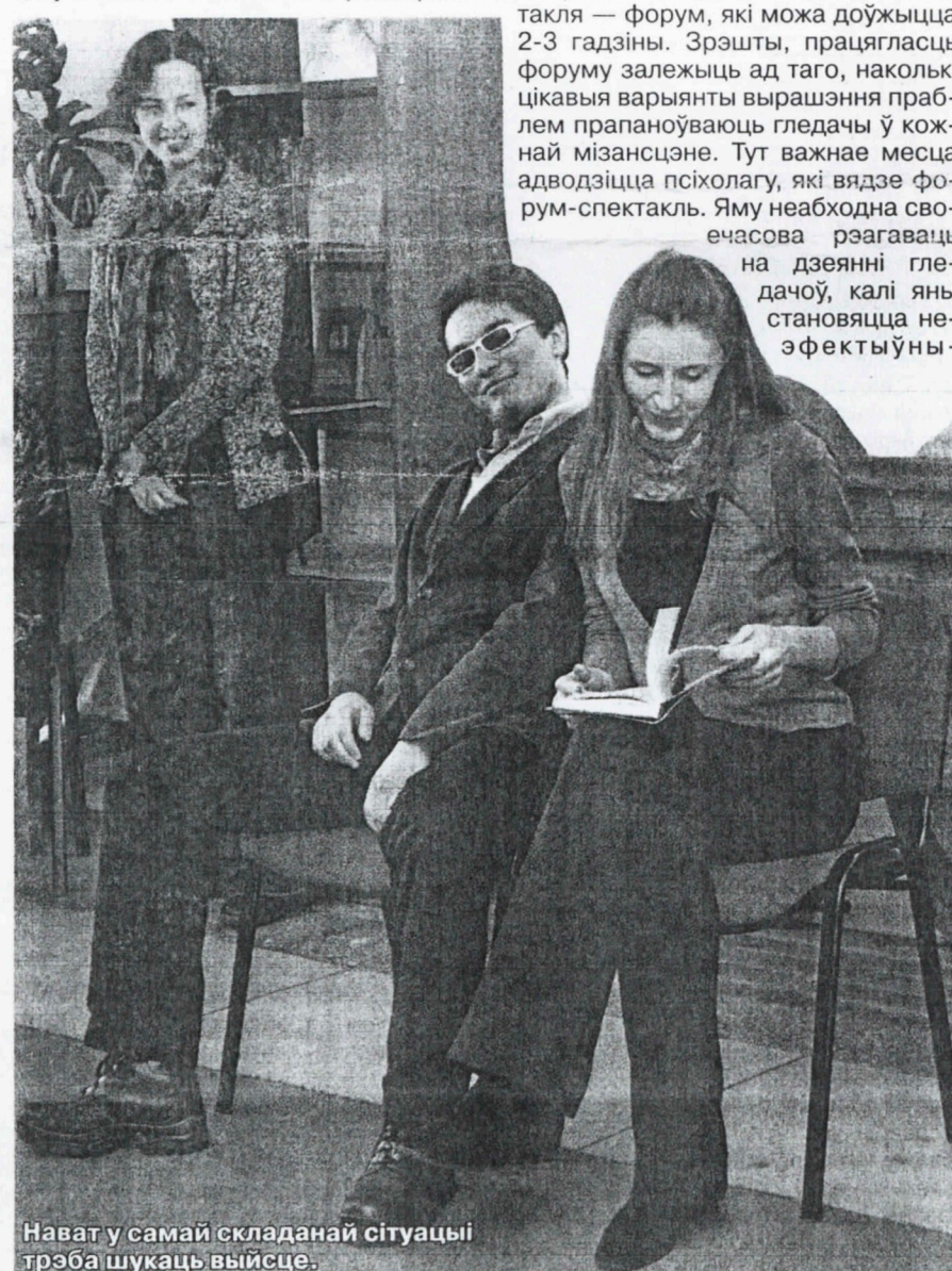
Нават у самай складанай сітуацыі трэба шукаць выйсце.

Адметна, што інтэрактыўным тэатрам зацікавіліся многія ўдзельнікі фэстывалю. Практычныя псіхологі на ўласным вопыце пераканаліся, наколькі дзейснай і цікавай можа быць такая незвычайная форма ўзаемадзейнення з моладдзю.