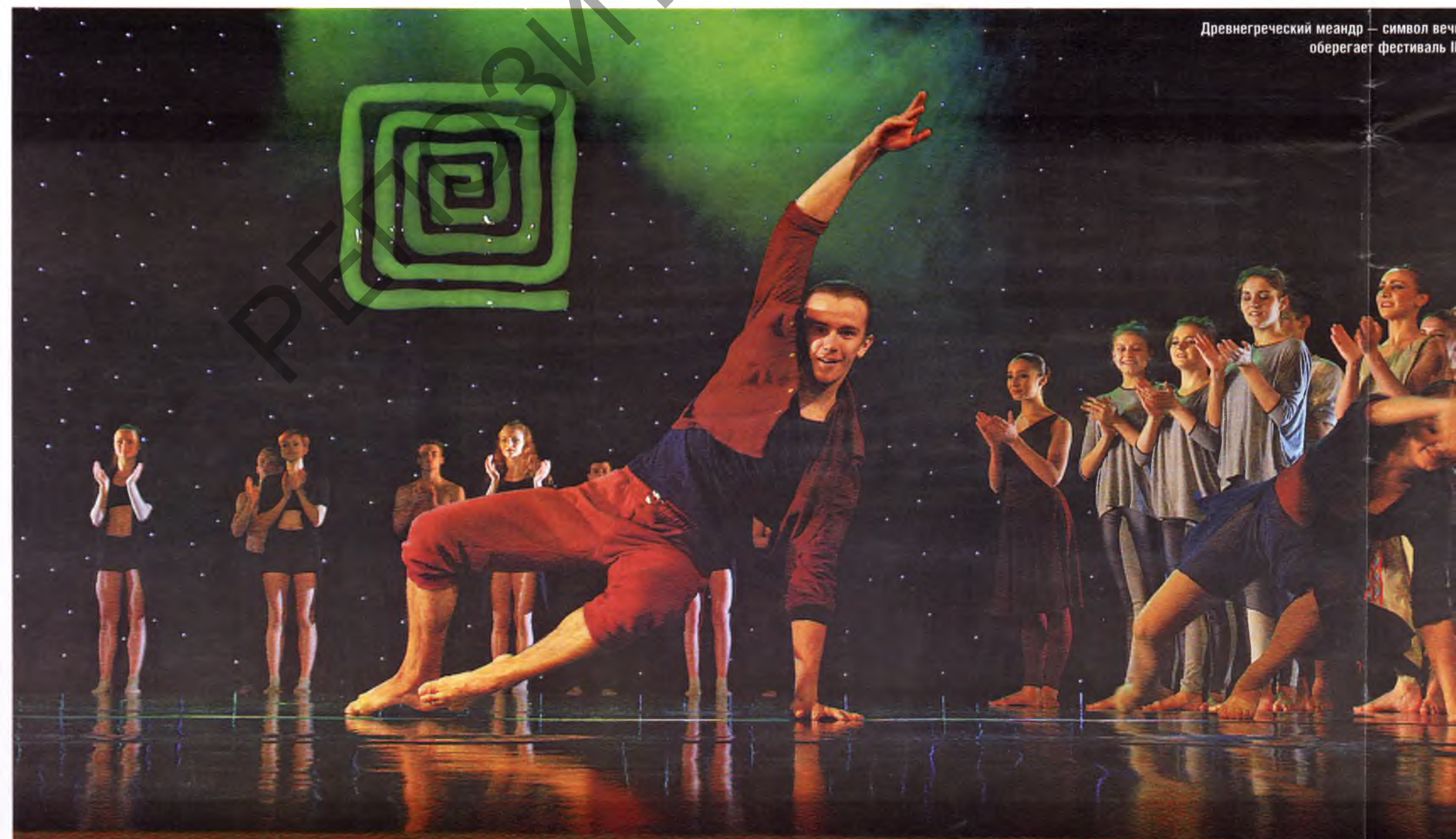
Древнегреческий меандр — символ вечности и оберегает фестиваль П