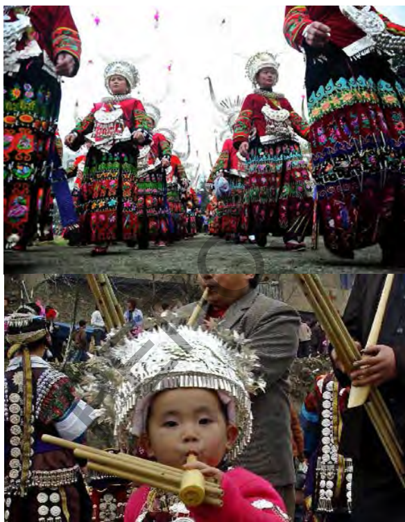
Рисунок 1 – Фестиваль народности мяо «Луйшин» и юный исполнитель на Луйшине.

Музыкальная фестивальная деятельность в Китае в начале XXI века формируется на региональном, национальном и международном уровнях, в среде профессионалов и любителей. Оценивая значение зрелищных мероприятий для развития искусства и культуры Китая, укрепления их престижа, активизации межрегиональных и международных контактов, государственные организации и частные лица концентрируют усилия на их поддержке и расширении. Основная их задача – внести свежую струю в культурную жизнь страны, региона, города, создать максимально широкое поле притяжения как для профессионалов в области искусства, так и для рядовых зрителей и слушателей, выявить и поддержать новые таланты. Благодаря разнообразию программ мероприятий, использованию широкого спектра разных форм рекламы, деятельности СМИ, музыкальные события получают широкий резонанс и становятся достоянием общественности.