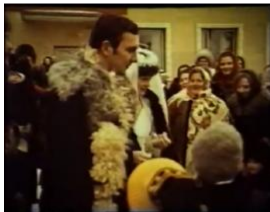
Малюнак 2 – Сцэны з дакументальных этнаграфічных фільмаў «Абрад Свахі» і «Палескія вяселлі» (1984) з удзелам маталіян