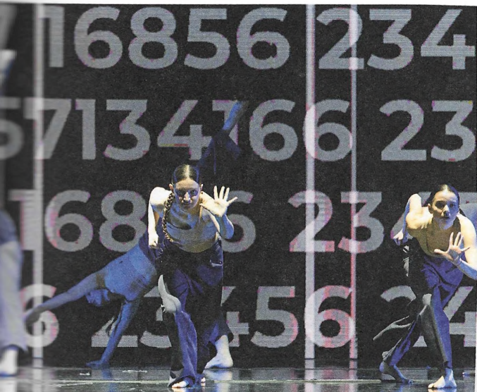
Эпизод «Цифры на сердце» трогает до слез