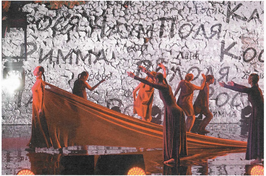
Эпизод «Хатынь». «Марафон единства» в Гомеле. 19 октября 2024 года

Роли детей исполняют маленькие чтецы – победители республиканского конкурса «Живое слово». Дети произносят простые, незатейливые слова от