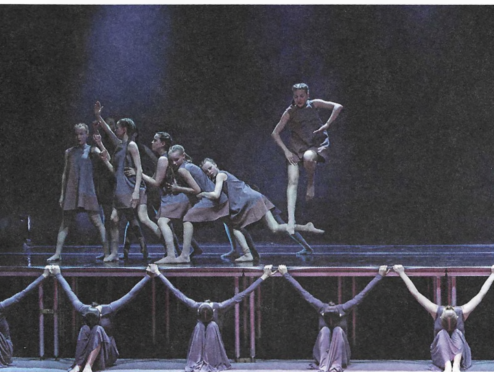
Эпизод «Красный Берег». Исполняют юные артисты Stay Dance Project из Рогачева. 2023 год

– Иногда мы играли два спектакля в день: в одиннадцать утра и в два часа дня. В перерыве обедали. Казалось бы, отдали столько энергии, что можно и расслабиться, и с аппетитом поесть. Куда там! У детей кусок в горло не лез. Очень тяжело ребенку, подростку спуститься из этого космоса в обычное, земное состояние. На это требуется как