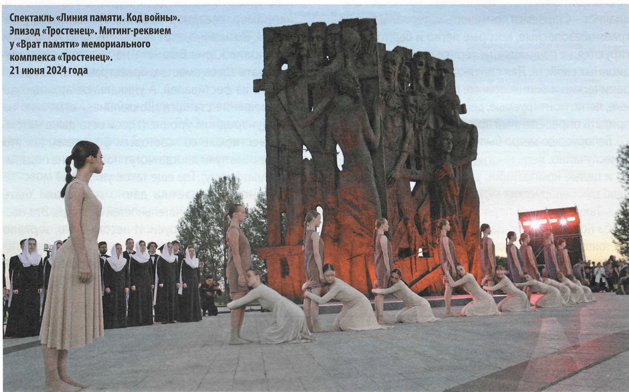
Спектакль «Линия памяти. Код войны». Эпизод «Тростенец». Митинг-реквием у «Врат памяти» мемориального комплекса «Тростенец». 21 июня 2024 года

Пересказать содержание этого спектакля сложно, потому что основное повествование ведется языком танца. Хореографические эпизоды – «Война», «Тростенец», «Красный Берег», «Три сестры», «Детские ботинки», «Цифры на сердце», «Хатынь» – перемежаются и дополняются детскими монологами и диалогами, цифрами и фактами о геноциде, которые проецируются на громадный экран и произносятся закадровым голосом. Сюжет-