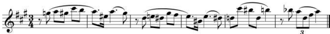
Пример 6 – Кларнет in B