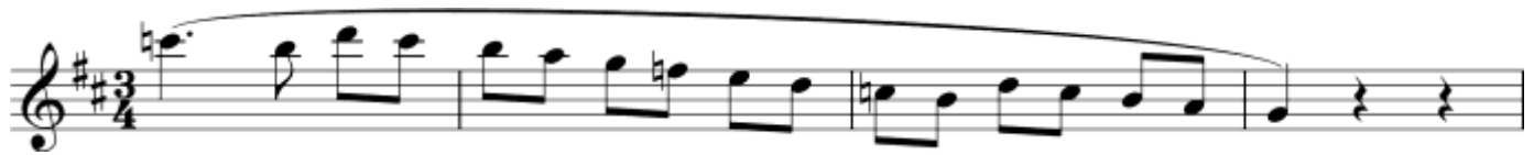
Пример 11 – Английский рожок