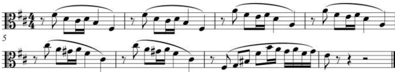
Пример 7 – Альт