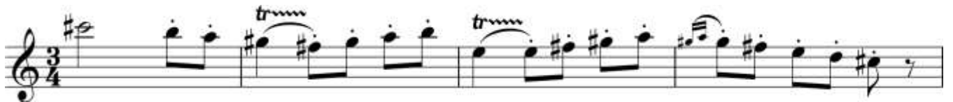
Пример 9 – Кларнет пикколо