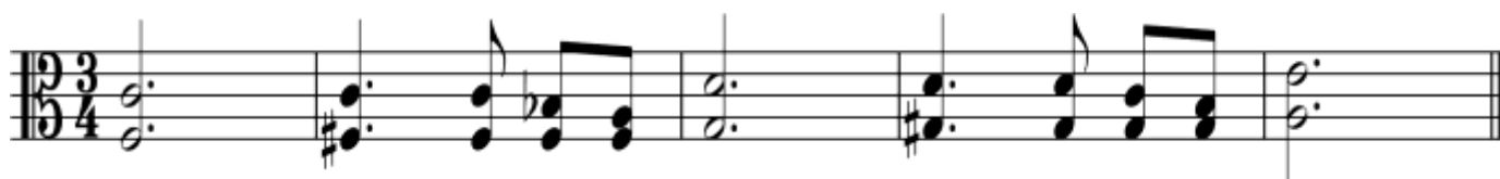
Пример 1 – Тромбон

Примеры, размещенные на одном нотном стане