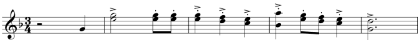
Пример 8 – Валторны in F