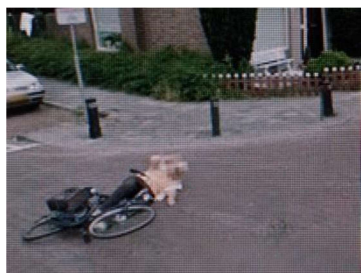
М. Вульф. Серия несчастливых событий (2011)

Р. Шор подчеркивает: «Если цифровая культура изменила практику фотографии, то есть способы съемки и демонстрации фотографий, то способы поиска и обработки найденных изображений также претерпели глубокие изменения» [4, с. 13]. К примеру, художники обратили внимание на технологию отображения интерактивных виртуальных панорам на картах. В проекте Майкла Вульфа «Серия несчастливых событий» (2011) используются фотографии Google Street View, что стало первым случаем использования этой технологии в художественной фотографии. Автор опирается на сюрреалистическую традицию присвоения и деконструкции заимствованных объектов и образов, и полученные изображения низкого разрешения уже не несут функции идентификации локации; образы города и его жителей перекодированы в подобие базы данных, и все, что требуется от фотографа, – это заставить интересующие его данные появиться из пространства виртуального города. Существует множество других фоторабот, созданных при помощи Google Photos, например «Голландский пейзаж» Мишки Хеннера (2011) и «Открытки с Google Maps» Клемента Валлы (2010–2012).