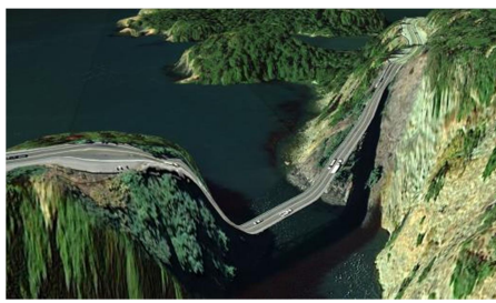
К. Валла. Открытка с Google Maps (2010)