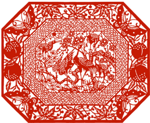
Рис. 4. Линь Бандун Сунхэ Яньнянь. 1989 г. (林邦栋. «孙河延年»)

Дуань Цзяньцзюнь – представитель мастерства вырезания хелингер во Внутренней Монголии [Там же, с. 56]. Его работа «Весна на лугу» (рис. 5) выразительная и пластичная, сочетает в себе одновременно плавные линии силуэта и жесткие линии мелких декоративных элементов, создающие впечатление сияния. Художник также занимается исследованием национального искусства цзяньчжи, практикой его охраны и защиты как нематериального культурного наследия.