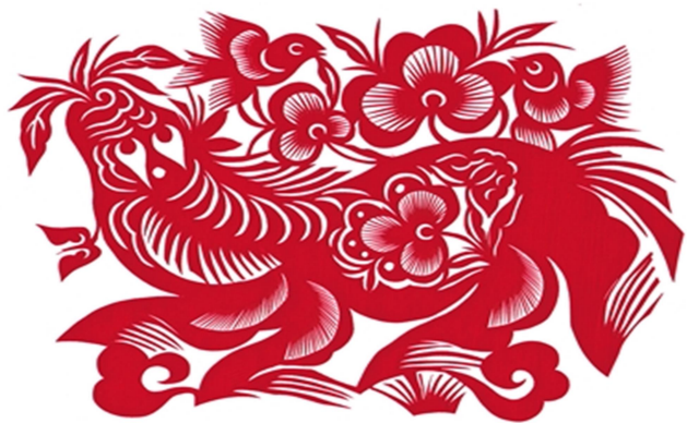
Рис. 5. Дуань Цзяньцзюнь Весна на лугу. 2007 г. (段建珺. «草地上的春天»)

Искусство вырезания из бумаги в Китае возникло, развилось и в конечном итоге получило широкое распространение в результате достаточно длительного исторического процесса без значительных внешних культурных экспансий. Современ-