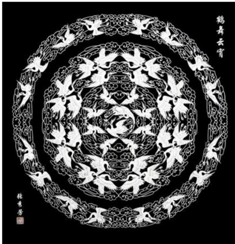
Рис. 2. Чжан Сюфан Танцующие в небе журавли. 2007 г. (张秀芳. «鹤舞长空»)