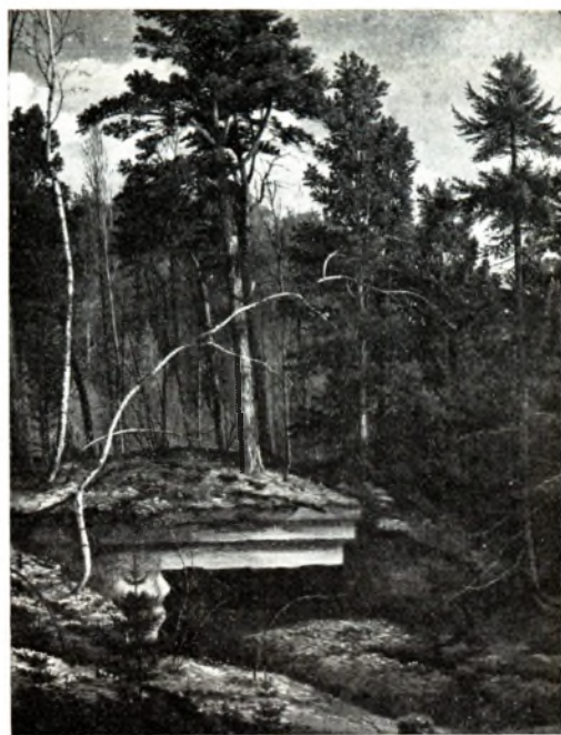
Л. Трахалёва. Дот. Алей. 1984.

створаны Дамы маст. самадзейнасці (з 1978 міжсаюзнай Дамы самадзейнай творчасці ). Студыі і клубы самадз. мастакоў і майстроў дэкар.-прыкладнога мастацтва сталі сапраўднымі цэнтрамі прапаганды маст. культуры і эстэт. выхавання працоўных. На 1.1.1987 у рэспубліцы ў культ.-асветных установах Мін-ва культуры БССР і Белсаўпрофа больш за 800 маст. гурткоў і студый выяўл. і дэкар.-прыкладнога мастацтва, у якіх займацца больш за 12 тыс. чал. (дарослых і дзяцей), 29 студый маюць званне народных і ўзорных (гл. Народныя студыі выяўленчага і дэкаратыўна-прыкладнога мастацтва ). Значны ўплыў на развіццё бел. С. в. і д.-п. м. зрабіў удзел бел. самадз. мастакоў і майстроў дэкар.-пры-