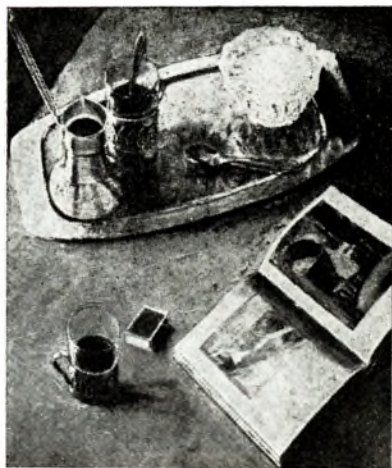
І. Кішкурна. Нацюрморт. Алей. 1983.

усяго сав. народа. У 1940—50-я г. С. в. і д.-п. м. атрымалі сваё далейшае развіццё. Гэты час характарызаваўся арганізацыяй значнай колькасці новых студый і гурткоў, правядзеннем творчых семінараў самадз. мастакоў, актывізацыяй выставачнай дзейнасці. У 1947, 1952, 1959 адбыліся рэсп. выстаўкі самадз. і нар. мастацкай творчасці, у 1955 выстаўка на Дэкадзе бел. мастацтва і л-ры ў Маскве. Значнае месца ў творчасці мастакоў-амагараў займалі тэмы Вял. Айч. вайны, адраджэння нар. гаспадаркі, роднага краю. У 1960—70-я г. актывізавалася дзейнасць арганізацыйна-метадычных устаноў. У 2-й пал. 1960-х г. былі