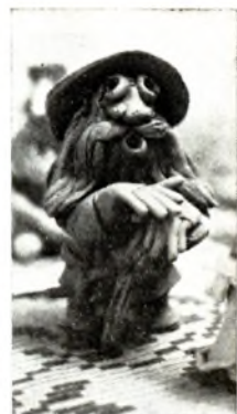
В. Гаўрыльчук. Пана. Саломка. 1984 (злева); С. Калкшыньскі. Дзядок. Шамот. 1980-я г.