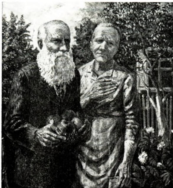
Л. Галаенка. Бацькі. Алей. 1983.