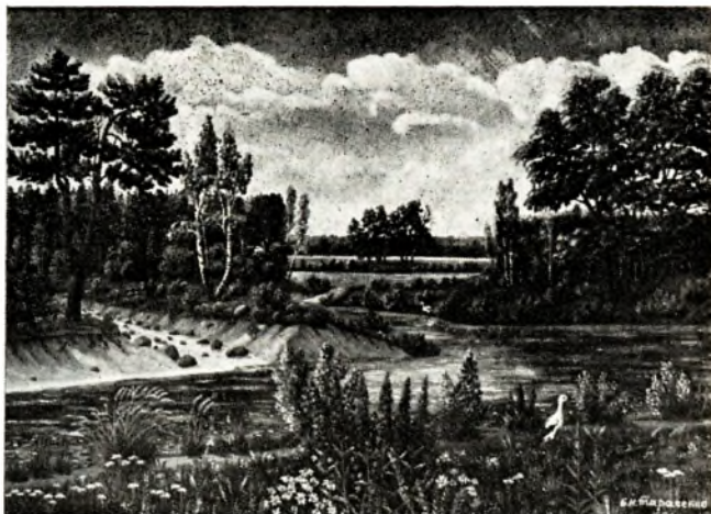
Б. Тарасенка. На палескіх прасторах. Алей. 1984.