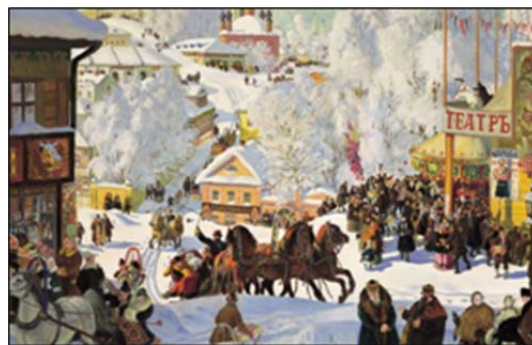
Б. Кустодиев «Масленица»

Некоторые группы горожан по образу жизни были близки к сельским жителям. Другие мещане в своем бытовом обустройстве и способах проведения свободного времени руководствовались соображениями престижа и социального самоутверждения, характерными для