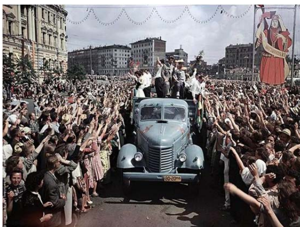
Фестиваль молодежи и студентов (Москва, 1957 г.)

С середины 1950-х гг. получили распространение агитационно-художественные бригады . Развитие на рубеже 1950–1960-х гг. «авторской песни» дало толчок возникновению в 1970 г. первых клубов самодеятельной песни (КСП). Со вто-