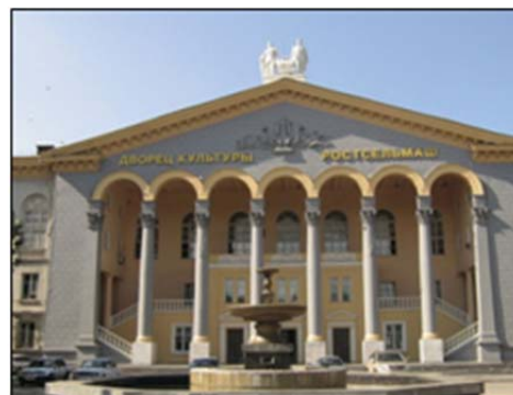
Дворец культуры Ростсельмаша