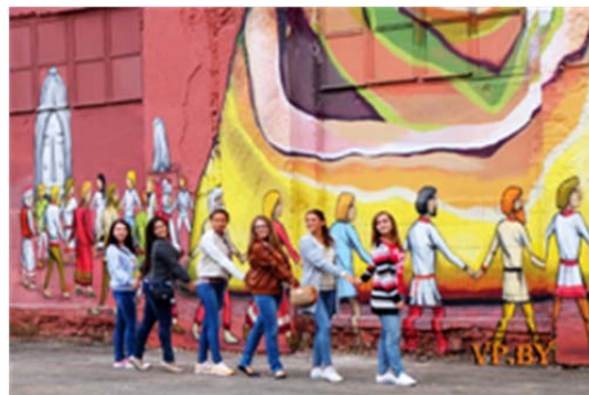
Улица Октябрьская в Минске

Одним из самых интересных, на наш взгляд, вариантов организации многофункционального социально-культурного пространства является новый жилой комплекс в европейском стиле в экологически чистом пригороде Минска под названием «Новая Боровая». Этот архитектурный проект успешно реализуется с 2014 г. Он задумывался как «город за городом», мини-пространство для удобной жизни, общения детей и взрослых. Организация пространства комплекса основана на принципах SMART+SOCIAL и dog-friendly. Жилые здания оборудованы пандусами и подъемниками для людей с ограниченными возможностями здоровья, светлыми и просторными входами, системой видеонаблюдения, удобной фурнитурой в подъездах, боксами для спама, комнатами для домашних питомцев, пунктами буккроссинга, площадками для отдыха, хобби-комнатами и кладовыми. В последние годы здесь были организованы бесплатные занятия по йоге, хореографические проекты, концерты, фестиваль забытых игр, мастер-класс по финскому образованию. Жильцы района организовали конкурс на лучшее новогоднее украшение.