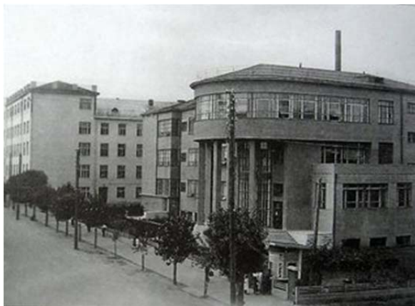
Государственная библиотека БССР им. В. Ленина, 1932 г.

Таким образом, 1920–1930-е гг. стали важным этапом в создании сети учреждений культуры в БССР. О происходивших на глазах людей изменениях ярко и образно написал народный поэт Беларуси Я. Купала: