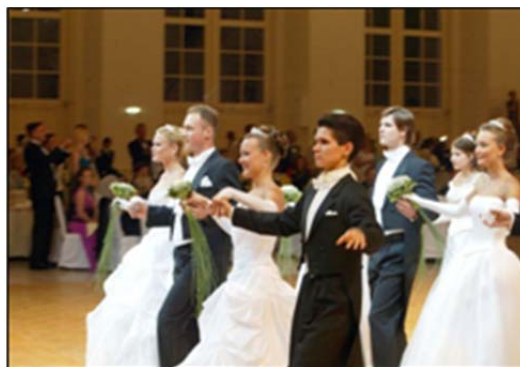
Рождественский бал в Большом театре Беларуси

В систему социального обеспечения и защиты населения в Республике Беларусь объединены социальное обслуживание, охрана труда, регулирование рынка труда, обеспечение занятости населения и предупреждение безработицы, профессиональная ориентация и переподготовка кадров, система оплаты труда, демографическая политика, помощь ветеранам, людям с ограниченными возможностями здоровья, детям-сиротам, многодетным семьям, пожилым людям. В нашей стране действуют районные, городские и областные управления по труду, занятости и социальной защите, управления социальной защиты администраций отдельных районов городов, территориальные центры социального обслуживания населения, дома-интернаты, государственные учреждения социального обслуживания «Дом ветеранов». Важнейшими направлениями работы социальных учреждений являются: