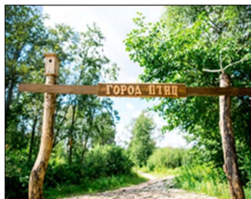
Экологическая тропа (г. Минск)

8) ответственность государственных органов, юридических лиц, индивидуальных предпринимателей за состояние здоровья населения;