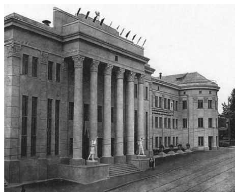
Дворец пионеров в Минске, 1936 г.

В 1928 г. в Москве был заложен Центральный парк культуры и отдыха (ныне ЦПКО им. А. М. Горького) и положено начало созданию новых типов учреждений культуры. Со второй половины 1930-х г. расширились средства распространения культуры: книгоиздательство, радио. Увеличилось