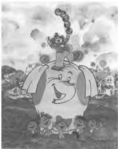
Да арт. Анімацыйнае кіно. Кадр з анімацыйнага фільма «Казка пра вясёлага клоуна».

На сюжэт жартоўнай бел. нар. песні знята стужка «Як служыў я ў пана» (2005, рэж. У.Пяткевіч). Унікальным з'яўляецца праект «Аповесць мінулых гадоў» (2006—08), прысвечаны гісторыі ўзнікнення гербаў гарадоў Беларусі (аўтар ідэі і маст. кіраўнік І.Воўчак, сцэнарысты Д.Якутовіч і М.Бяршадская, рэж. У.Пяткевіч, М.Тумеля, І.Кадзюкова, А.Ленкін, Н.Хаткевіч, маст. А.Мацюшэўская, Т.Кубліцкая, Я.Надточэй, Н.Касцючэнка). Серыя фільмаў «Беларускія прымаўкі» (2007—08, сцэнарыст і рэж. М.Тумеля, маст. А.Мацюшэў-