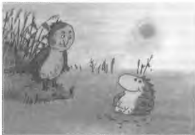
Да арт. Анімацыйнае кіно. Кадр з анімацыйнага фільма «Ёрш і Верабей».

выяўл. сродкі А.к., засвойваліся розныя тэхналогіі: «ажыўшы жывапіс», камп'ютэрная анімацыя, кінакалаж (спалучэнне анімацыі са здымкамі з прыроды і жывога актёра) і інш. На сучасным этапе бел. А.к. вызначае высокі прафес. ўзровень, разнастайнасць творчых манер. Ствараюцца анімацыйныя казкі «Чароўная крама» (2006), «Жабка-вандроўніца» (2007), «Жыла-была апошняя Мушка» (2009, рэж. усіх А.Пяткевіч), «Залатыя падковы» (2006, рэж. І.Кадзюкова), «Пра сяброўства, Шарыка і лятаючую талерку» (2008, рэж. А.Ленкін). Гісторыя жыцця праваслаўных святых — Пятра і Феўронні — адлюстравана ў анімацыйнай стужцы «Старадаўняя аповесць пра жыццё, любоў і іншыя дзівы» (2008, рэж. І.Кадзюкова).