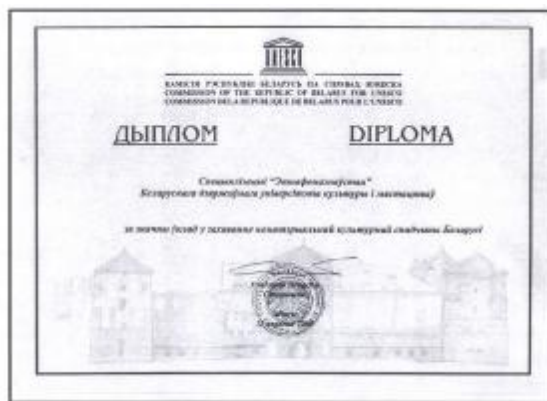
Мал. 2. Дыплом за захаванне НКС, якім узнагароджана спецыялізацыя «Этнафоназнаўства». 2008 г.

Трэцяя спроба ладзіцца зараз па матэрыялах экспедыцый супрацоўнікаў і навучэнцаў БДУКіМ на Полацкае купалле, наладжаных пры дапамозе вядомай даследчыцы-палевіка, журналісткі Рэгіны Гамзовіч.