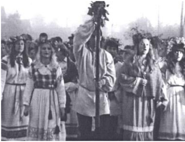
Мал. 1. Рэвіталізацыя Купалля як дыпломны праект першага выпуску этнафоназнаўцаў (2009 г.) пад кір. Т. А. Пладуновой.

ную не надта хістае такое вызначэнне: каб напісаць 40-ю сімфонію альбо вырабіць карынкскую бронзавую вазу замест таго, каб узлезці на пальму з бананам у сківіцах, людзі павінны папярэдне пэўным чынам упарадкаваць сваю свядомасць і паводзіны.