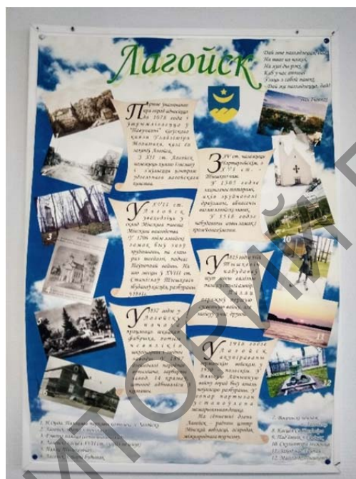
Мал. 3. Стэнд, прысвечаны першаму беларускаму музею ў Лагойску.