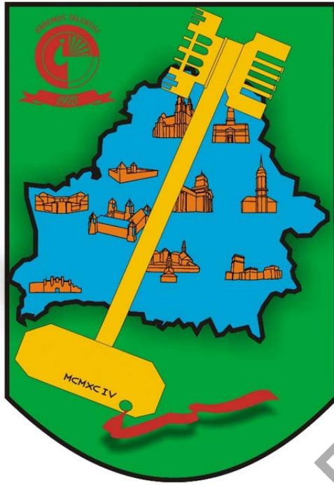
Мал. 4. Герб спецыяльнасці 1-21 01 12 Музейная справа і ахова гісторыка-культурнай спадчыны.