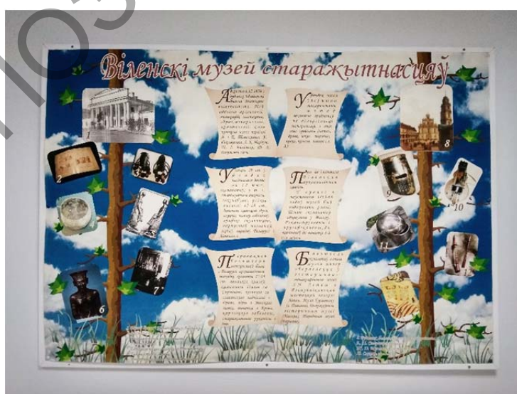
Мал. 2. Стэнд, прысвечаны Віленскаму музею старажытнасцей.