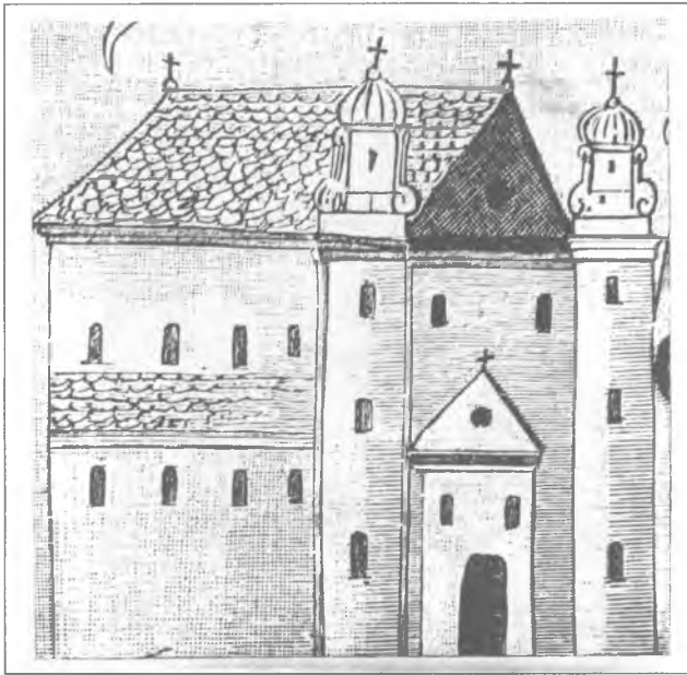
Брэсцкая Мікалаеўская абарончая царква XVI ст.

дахоўку. Гісторык архітэктуры Алесь Кушнярэвіч адзначае, што дахоўка амаль да апошняга часу захоўвалася ў паўночным схіле даху асноўнага аб'ёму і апсіды, а таксама была прасочана ім пры даследаванні падмуркаў і сцен сутарэння 11 .