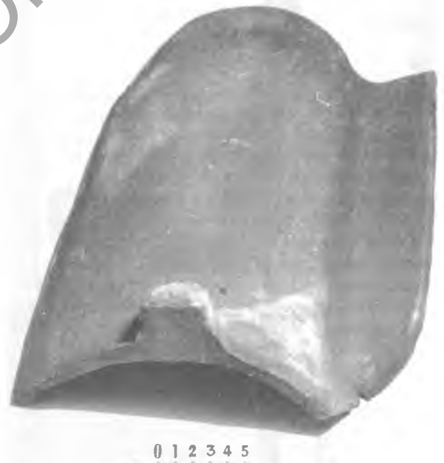
Хвалістая дахоўка XVIII—XIX ст.