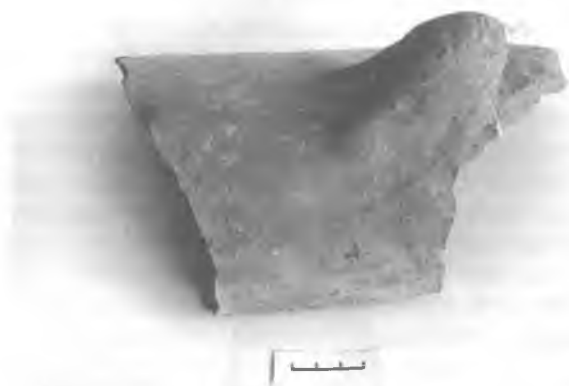
Фрагмент дахоўкі XIV ст. Лідскі замак.