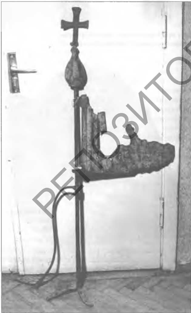
Ветранік канца XVIII ст.

Варта адзначыць, што ў XIX і асабліва ў XX ст., істотна мянялася форма стрэхаў і дахаў вясковых і гарадскіх драўляных будынкаў. Этнографы адзначаюць, што найбольш старымі традыцыйнымі ўпрыгожваннямі беларускай хаты з'яўляюцца вільчакі, што былі яшчэ на курных хатах. У этнаграфіі вільчак — гэта разное ўпрыгожанне вяршыні франтона (шчыта) пры двухсхільнай страсе. Верхнія канцы дошак, што закрываюць тарцы абрашоткі страхі, выразаліся ў выглядзе розных фігур. Найбольш пашыранымі былі вільчакі ў выглядзе конскіх галоў. Большасць з іх схематычныя, але былі і па-мастацку выпіленыя галовы коней з вачыма, вушамі, грывай і іншымі дэталямі. Таксама існавалі вільчакі ў выглядзе каровіных рагоў ці птушыных галоў. Для старых вільчакоў былі