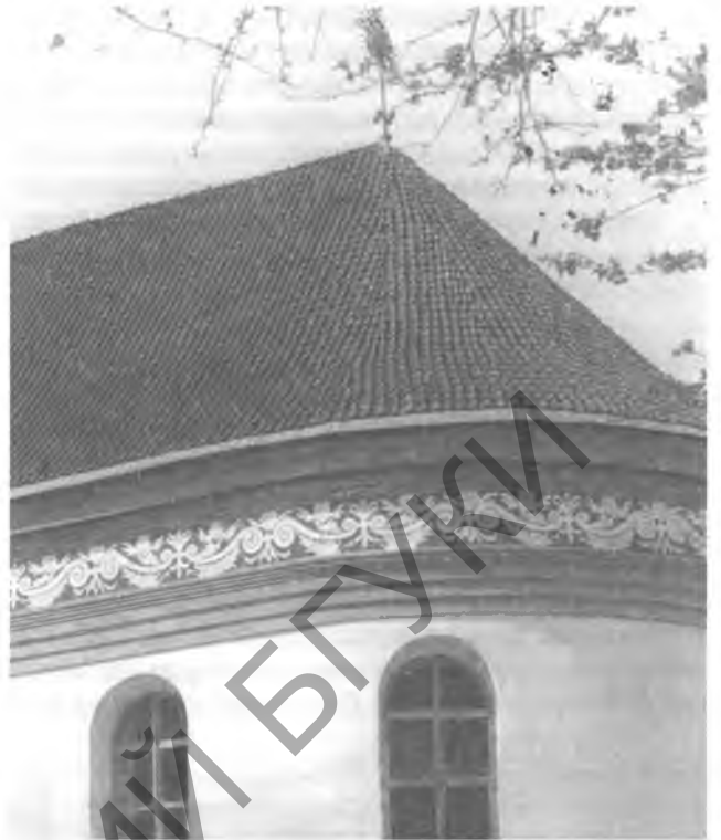
Дах брыгіцкага касцёла ў Гродне, пакрыты хвалістай дахоўкай.

У канцы XVIII ст. будынкi эпохі класіцызму атрымалі невысокія двухсхільныя дахі з франтонамі. У гэты час для накрывання дахаў з'явіўся новы матэрыял — тонкае ліставое жалеза, што на Беларусі атрымала назву "бляха". Майстроў, якія ўмелі накрываць дахі жалезам, а таксама вырабляць з яго розныя дэталі, такія як жолабы і трубы для адводу дажджавой вады, называлі бляхарамі. Аднак вытворчасць дахоўкі і гонты не спынілася, а набыла заводскі або фабрычны характар. У XIX — пачатку XX ст. выраблялі традыцыйную хвалістую, тонкую пляскатую і рэльефную