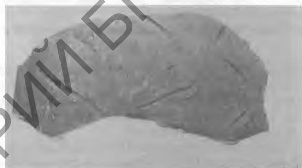
Меткі на фрагментах дахоўкі XIV ст. Навагрудскі замак. Раскопкі М.Малеўскай. 1968 г.