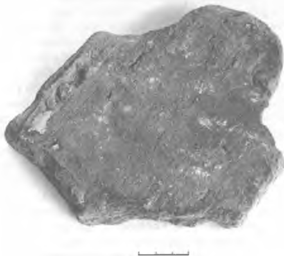
Фрагмент дахоўкі XV ст. "бабровы хвост". Стары замак у Гродне. Раскопкі аўтара.