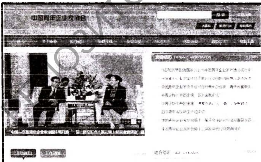
Рис. 2 Главная страница сайта Ассоциации молодых предпринимателей Китая

В 1985 году в КНР была образована Ассоциация молодых предпринимателей Китая (аббревиатура CYEA), с целью «единения, образования, обслуживания и руководства» молодыми предпринимателями. Адрес сайта Ассоциации – http://www.cyea.org.cn/ (рис. 2).