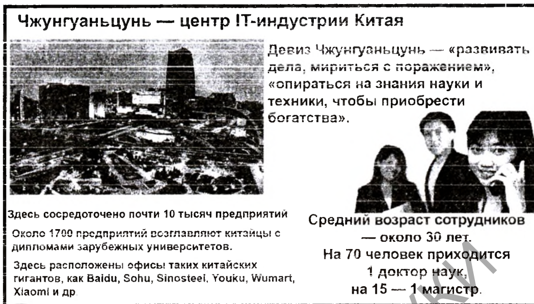
Рис. 4 Развитие технопарка «Чжунгуаньцунь»

Таких успехов невозможно было бы достичь без научного подхода. Большой вклад в развитие технопарка вносят научно-образовательные учреждения, расположенные на его территории – Академия наук КНР, Пекинский университет, университет Цинхуа, на базах которых ведутся исследования и разработки в таких областях как биология, фармацевтика, космос. В области исследований альтернативных источников энергии Чжунгуаньцунь занимает лидирующие позиции в стране. Научную базу силиконовой долине обеспечивает 140 вузов, 39 колледжей, общая численность студентов превышает 400 тыс. человек. Руководством «силиконовой долины» созданы благоприятные условия для специалистов, получивших образование за рубежом и решивших вернуться на родину. Каждый четвертый находит работу по специальности именно в Чжунгуаньцуне. Общая численность сотрудников этой научной зоны перевалила за миллион [6].