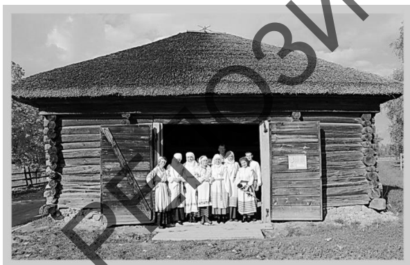
Малюнак 1 – На дыпломным праекце курса Н. Петуховай – гурта «Вяснянка». БДМНАіП, 2013

Энгельс Канстанцінавіч быў феноменальным выкладчыкам. Ён уразіў мяне сваёй энэргічнасцю і харызмай з першай лекцыі. Прафесар востра адчуваў актуальны час, відавочна небяспечны для традыцыйнай культуры ды яе аксіялагічнай асновы, на яго думку, знітаванай з выжываннем чалавечтва ўвогуле і беларусаў як народа ў прыватнасці. Тэмы, якія абмяркоўвалі, былі важнымі і актуальнымі, а яго заняткі заўжды хацелася наведаць, бо прысутнічалі мы (фальклорны гурт «Вяснянка» – 2008–2013 гг. – клас дацэнта кафедры этналогіі, кандыдата педагагічных навук Наталлі Петуховай) на іх толькі з задавальненнем: вопыт і майстэрства Э. Дарашэвіча іншага варыянта нам не пакідалі. На лекцыях ён выступаў у ролі выдатнага апавядальніка і падбіраў цікавыя ілюстрацыйныя матэрыялы. Прычым з надзвычай дасведчаным і эрудыраваным прафесарам Э. Дарашэвічам нам было вельмі проста і вельмі цікава весці дыялог: студэнтаў ён не толькі с л у х а ў , але і ч у ў .