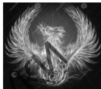
Рисунок 3 – Горящий феникс, тотем народа Чу, мастера которого изготовили барабан

Темново-акустически большой барабан – источник мощного, далеко разносящегося звука. В художественном декоре данного артефакта именно тигры воплощают громкий звук. Это выражает их внешний облик: толстые губы, узкие и глубокие рты, выпуклые глаза, короткие уши, мощная грудь, длинное стройное тело, гибкая шея. Звук барабана в сочетании с напряженной позой тигров оставляет акустическое впечатление рычащего хищника. Другой аспект звучания барабана связан с вибрирующими и мелодичными интонациями пения птиц, воплощенными в фигурах фениксов. Звучание барабана в единстве с эстетикой и символикой его пластичного визуального оформления оставляет глубокое впечатление, в котором синтезированы аудиовизуальные свойства инструмента.