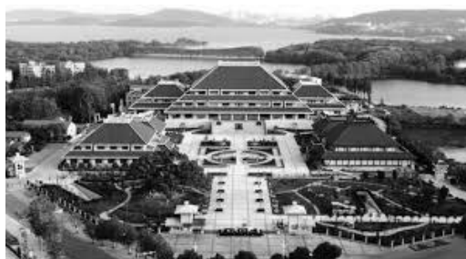
Рисунок 2 – Музей провинции Хубэй (1953, Ухань)