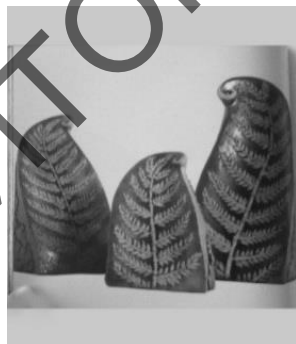
Рисунок 3 – В. Григоришина. Цветок папоротника