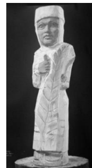
Рисунок 5 – И. Супрунчук. Женщина с папоротником

Работа И. Коваленко «Золотой цветок» (бел. «Залатая кветка», 2007, шамот, глазури, оксиды, редукция, высота – 41 см) напоминает кубок с запечатанным верхом или перевернутую печать (рис. 2). Художник интерпретирует образ мифического растения не только с помощью формы, но и колористической гаммы. Ножка и бока предмета покрыты узором черного цвета, в которых просматривается образ листьев и стеблей папоротника. На верхней части произведения художник располагает полихромные растительные мотивы, среди которых следует обратить внимание на лепестки золотисто-желтых оттенков, окружающих стилизованный цветок красного цвета. Данное произведение можно связать со строками стихотворения В. Короткевича «В ту ночь»: «Кветка ў нетрах лясных распускалася, // Залатая, агністая, сіняя». Верхняя часть произведения напоминает лист клевера с четырьмя лепестками, который так же, как и цветок папоротника, является мифологемой и символизирует удачу.