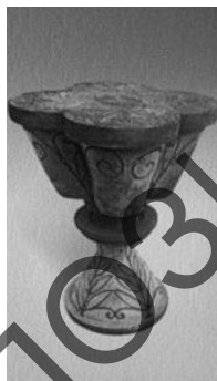
Рисунок 2 – И. Коваленко. Золотой цветок