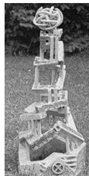
Рисунок 4 – Л. Нищик. Цветок папоротника