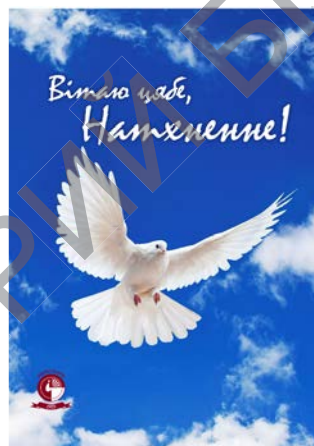
Вітаю цябе, Натхненне! матэрыялы па стылістыцы і культуры маўлення / уклад.: А. Багамолава [і інш.]. – Мінск: БДУКМ, 2015. – 138 с.

На пасяджэннях «БУКета» студэнты і выкладчыкі зачитваюць і абмяркоўваюць творы, наладжваюць палеміку, рыхтуюць тэарэтычныя паведамленні, прысвечаныя цікавым літаратурным з'явам і працэсам, новым літаратурным жанрам, формам, арыгінальным вобразам і г. д. Вершы і апавяданні студэнтаў з'яўляюцца пачаткам далейшай складанай працы, абавязковы элемент якой – літаратурная вучоба, знаёмства з творчай пісьменніцкай лабараторыяй. Маладыя літаратары спрабуюць сябе ў розных мастацкіх жанрах, шукаюць сродкі выказаць асабістыя перажыванні, пачуцці з да-