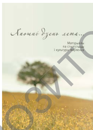
Апошні дзень лета: матэрыялы па стылістыцы і культуры маўлення / уклад.: А. Багамолава, В. Шунейка. – Мінск: БДУКМ, 2019. – 156 с.

памогай тропай і стылістычных фігур, цікавых і адметных асацыяцый.