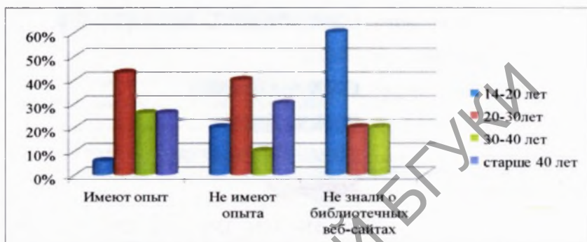
Рисунок 1 – Опыт респондентов по использованию библиотечных веб-сайтов (по возрастному признаку)

возрасте 14–20 лет (6%). Из 20% опрошенных, которые не использовали веб-сайты, 40% составили пользователи в возрасте 20–30 лет и 30% – в возрасте старше 40 лет. Среди 10% респондентов, которые не знали о существовании библиотечных веб-сайтов, наибольший удельный вес составили пользователи в возрасте 14–20 лет – 60% (см. Рисунок 1):