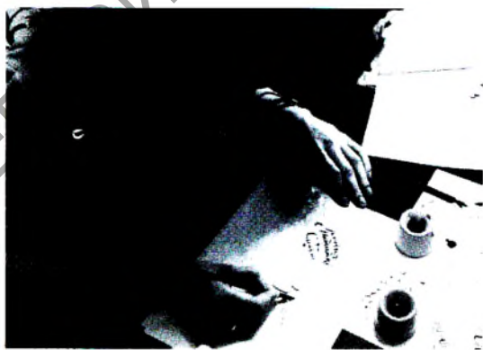
Рис. 6. Занятие каллиграфией в музее „Простых вещей“ Слоим, 2016 [8]

Конечно, немногочисленные частные музеи антиквариата, такие как музей „Простых вещей“ в Беларуси XXI века, как правило, пока ещё довольно скромны по выставочной площади, а также по объёму своих коллекций. Эти музеи начали появляться „на волне“ частной инициативы и предпринимательства с 1990-х годов, когда иметь ценные антикварные вещи и экспонировать их в приватном,