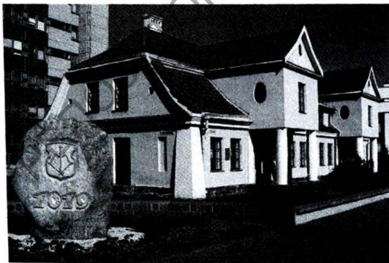
Рис. 7. Здание музея „СХЦ“ (ранее — жилой коттедж по проекту польского архитектора Ю. Лисецкого), 1925—1927 гг. Брест, современный вид [9]

Отдельный зал также посвящён иконописи Нового времени. Он демонстрирует разнообразие сюжетов и стилистических направлений русских икон XVIII — начала XX веков („Святитель Николай“, „Шестоднев“, „Рождество Христово“, „Рождество Богоматери“, „Избранные святые“, „Чудо Святого Георгия о змие“, „Святая Евфросиния Полоцкая“). При этом следует отметить, что редкий образец подписной (с указанием имени автора) иконы „Чудо Святого Георгия о змие“ (рис. 8) был передан брестскими таможенниками краеведам ещё в 1953 году — до открытия специализированного музея антиквариата [9]. Почётно украшают экспозицию культового искусства мелкая пластика и ростовская финифть. Среди экспонатов русского медного художественного литья XIX — начала XX вв. есть все основные разновидности предметов, сюжетов и изводов меднолитой пластики того времени.