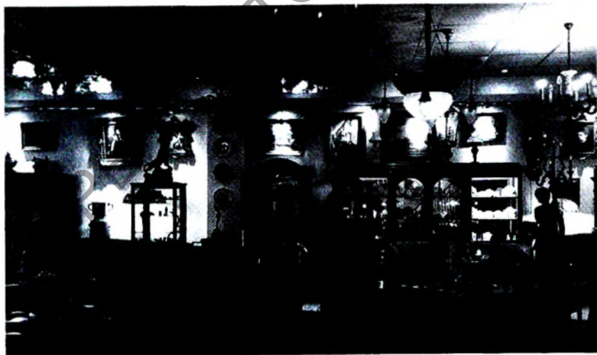
Рис. 2. Интерьер частного антикварного музея „Kunst-Cafe-Antik“ Дрезден, 2017 [7]