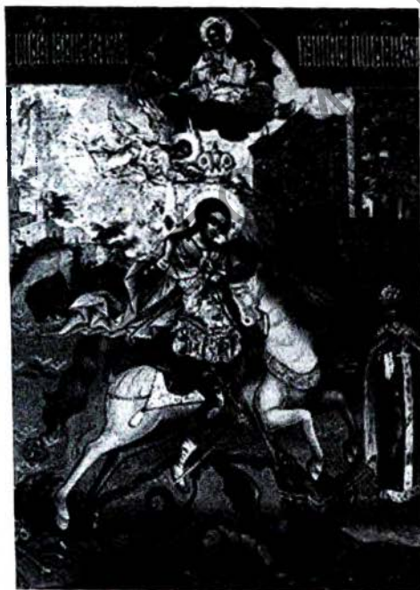
Рис. 8. В. Фетцов „Чудо Св. Георгия о змие“, икона, нач. XIX в. Брест, музей „СХЦ“ [9]

Остальная экспозиция музея „СХЦ“ хоть и не сравнится по своей ценности с памятниками иконописи, но она не менее интересна в каждом из следующих залов: искусства Востока (традиционная японская живопись на шёлке, японский фаянс, китайские вазы, буддийские иконы и мелкая пластика из бронзы и слоновой кости, кавказские кинжалы в серебряных оправах (рис. 9), наборные кавказские металлические пояса, медночеканная посуда из Центральной Азии); европейского декоративно-прикладного искусства (изделия европейских фарфоровых заводов, инкрустированная антикварная мебель из ценных пород дерева, бронзовые канделябры, старинные каминные часы); русской живописи (полотна Ивана Айвазовского, Сергея Виноградова, уроженца Беларуси Аполлинария Горавского, Алексея Кившенко, Юлия Клевера, Григория Мясоедова, Руфина Судковского); западноевропейской живописи (полотна Виллема ван де Вельде Младшего, Иосифа Фридриха Августа Дарбеса); графики (эскиз Михаила Врубеля к картине „Демон поверженный“, литография Фернана Леже, английские гравюры начала XIX века и другие произведения) [9].