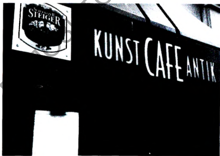
Рис. 1. Вход в частный антикварный музей „Kunst-Cafe-Antik“ Дрезден, 2018 [7]

Со временем коллекция частного музея переехала в просторную трёхкомнатную квартиру, поскольку обособленного помещения для экспонатов у четы коллекционеров так и не появилось. Кроме того, у них возникли определённые проблемы с арендой помещений: „Учитывая арендную плату и уход за помещением, я ещё останусь должна государству за то, что устраиваю в городе выставки“ [8], — так объясняет сложившуюся ситуацию Нина Анищикова. Поэтому