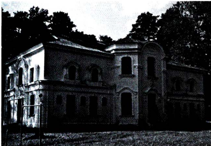
Рис. 4. Зимний дворец поместья графского рода Пусловских „Альбертин“, XIX век. Слоним, современный вид [10]