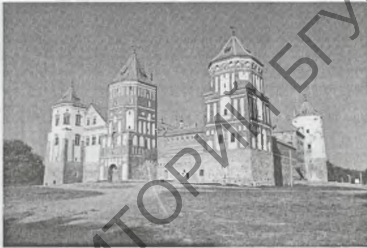
Мірскі замак. Сучасны выгляд

скага лічыўся замак вялікага князя ў сталіцы. Існавала і шмат іншых княжацкіх замкаў. Пабудовы такога кшталту размяшчаліся ў галоўных гарадах удзельных князёў. Напрыклад, у 1254 г. вялікім князем быў абраны Войшалк, які заставаўся ў сваёй рэзідэнцыі ў Навагрудку з 1258 па 1263 г. У Крэўскім замку да 1345 г. жыў сын Гедзіміна — Альгерд. Пасля смерці вялікага князя Гедзіміна сталіцай